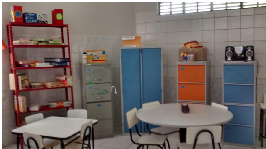
Figura 2 – Material Pedagógico da Sala de Recursos

Assim como observamos na figura acima, as mesas são sempre compartilhadas pelos alunos, existem vários jogos que são utilizados durante as atividades.