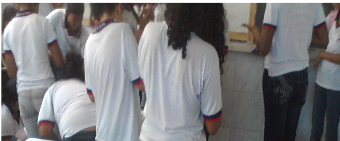
Figura 2 - Alunos das Salas de Recursos descrevendo as atividades realizadas na Sala

O aluno da Sala de Recurso que levou os colegas para conhecer a sala e suas atividades, o mesmo colocou um pedaço de papel metro no chão e solicitou que todos fizesse desenhos e que depois esses desenhos virariam uma história, estimulou que todos os colegas participassem, foi divertido e animado.