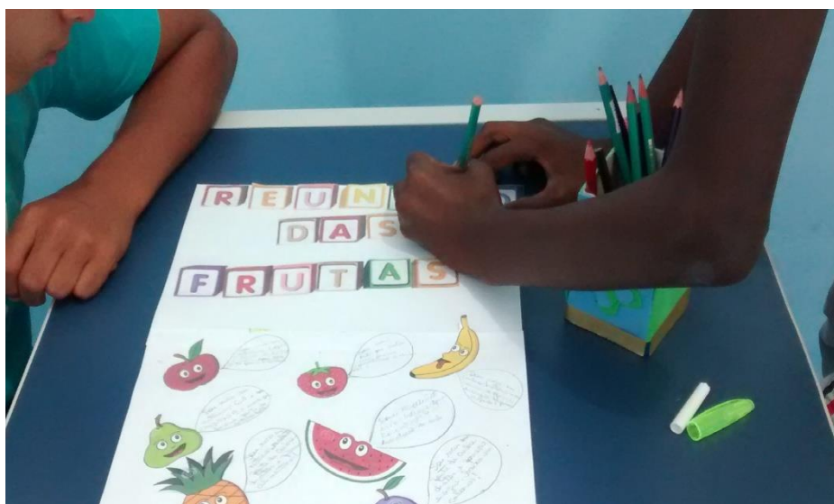
Figura 4 - Realização de atividades figuras e letras escolhidas por alunos

Na presente observação a professora acolheu dois alunos com dificuldade de aprendizagem, entregou folhas com diversas figuras e estes escolheram-nas de frutas e letras para recortar e colar, orientando que esses deveriam construir um texto juntos, solicitou que informassem nesse texto gostam e não gostam de comer. Os alunos resolveram fazer um texto chamado “reuniões das frutas”. Durante todo o tempo da atividade a professora ficava apenas observando e quando questionada, retornava a questão aos alunos, para que esses expressassem sua opinião. Durante a atividade os alunos conversavam como deveriam fazer aquele texto, depois de decidiram, emendaram duas folhas de ofício, utilizar as letras para fazer o título, pois se fizessem a história com as letras escolhidas não tinham como colocar todas as figuras como desejavam. Perguntaram para a professora se poderiam fazer assim, ela disse que eles poderiam sim, pois a história eram deles. É importante destacar que predomina aqui a aprendizagem e não simplesmente o ensino, como na abordagem tradicional.