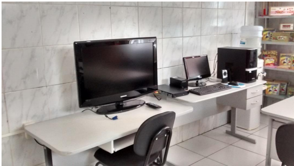
Figura 1 - Instrumento Tecnológico (computadores) da Sala de Recursos

Como podemos observar na figura acima, a Sala de Recursos, lócus da pesquisa, apresenta um espaço amplo, arejado, é climatizada, com claridade adequada, traz instrumentos pedagógicos condizentes para o trabalho a ser realizado, visualiza-se exposição de material pedagógico produzidos pelos educandos expostos adequadamente, sem poluição visual, decorações pedagógicas diversificadas possibilitando o atendimento, tanto crianças, quanto de adolescentes.