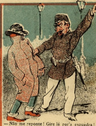
— Não me reponte! Gire lá par'a esquadra!