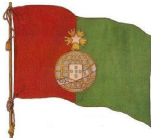
A bandeira da Carbonária Portuguesa de 1910