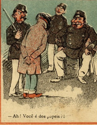
— Ah! Você é dos papeis!