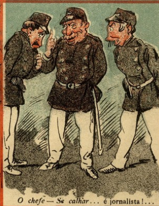
O chefe — Se calhar... é jornalista!...