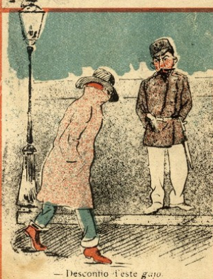
— Desconto deste gajo.