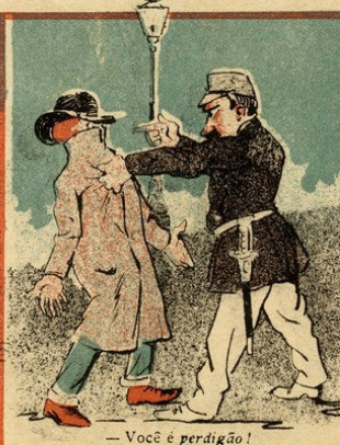
— Você é perdigão!