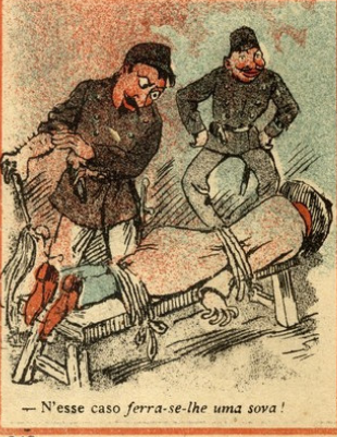
— N'esse caso ferra-se-lhe uma sova!