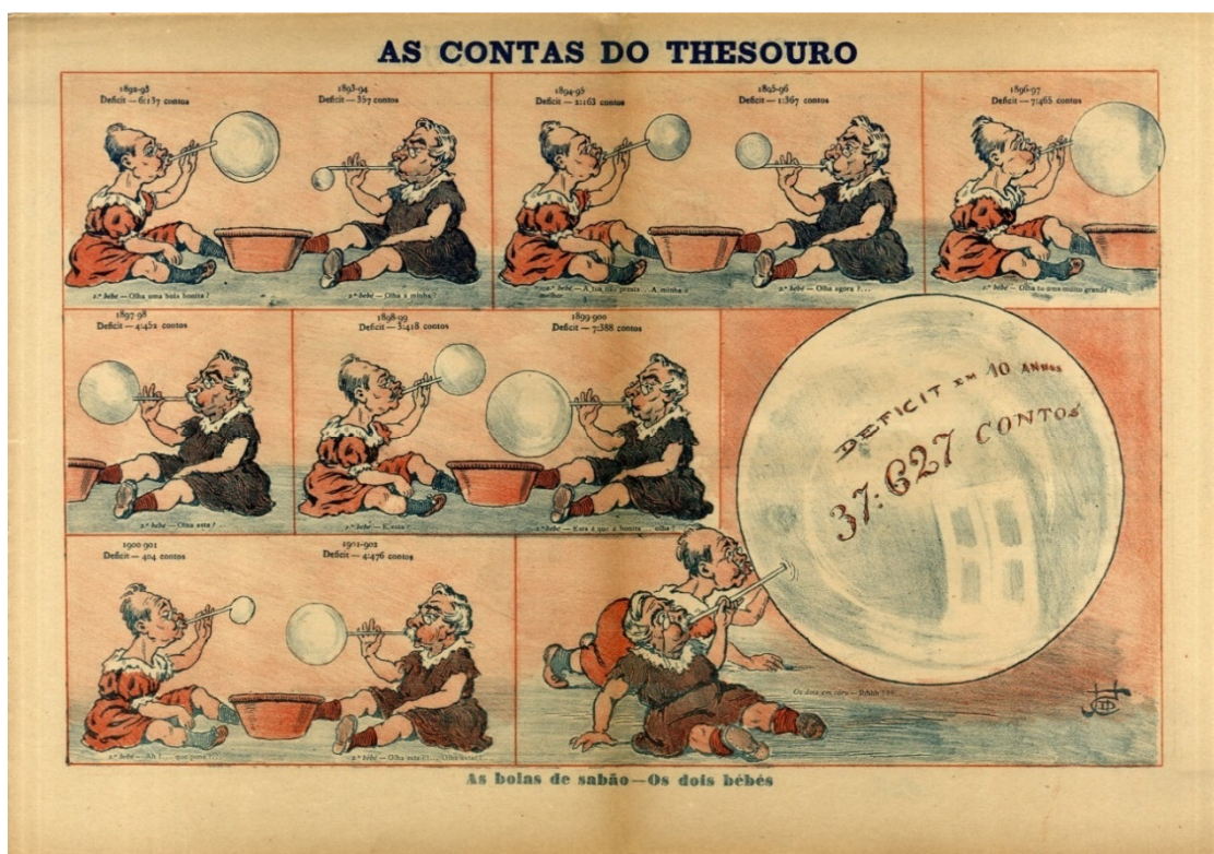
Fonte: “A Paródia”. Ano 1, n.º 38. 1 Out. 1900: 4. In http://hemerotecadigital.cm-lisboa.pt/Periodicos/AParodia/1903/N38/N38_item1/P4.html (consultado em 6 de fevereiro de 2016).