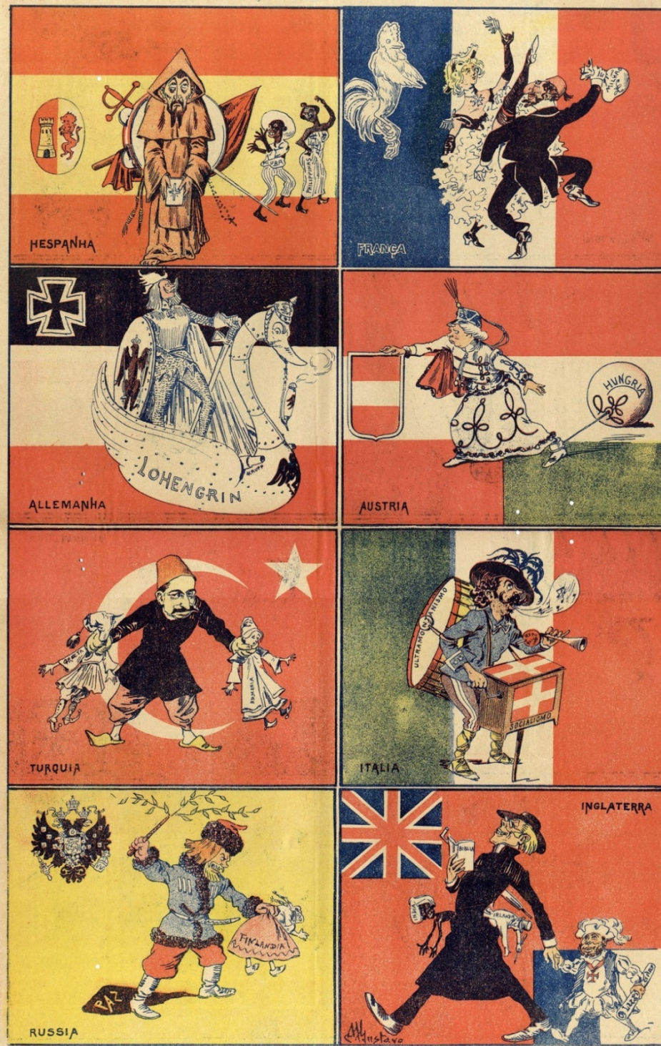
Código de bandeiras