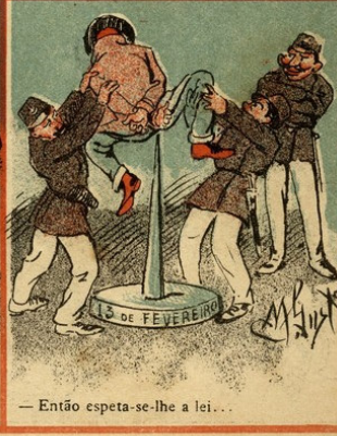
— Então espeta-se-lhe a lei...