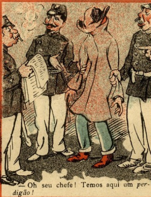
— Oh seu chefe! Temos aqui um perdigão!