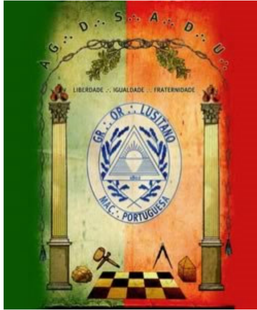
Um dos estandartes do Grande Oriente Lusitano