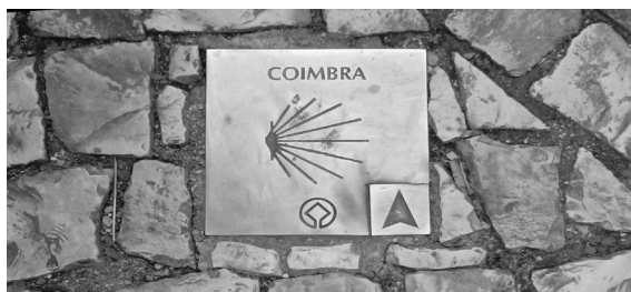
Fig. 1 – Marca a assinalar o Caminho de Santiago na cidade de Coimbra.

Ainda na zona centro de Portugal, associar o “caminho”, no sentido literal, ao sentido que pode ter a nível religioso ocorre, por exemplo, no