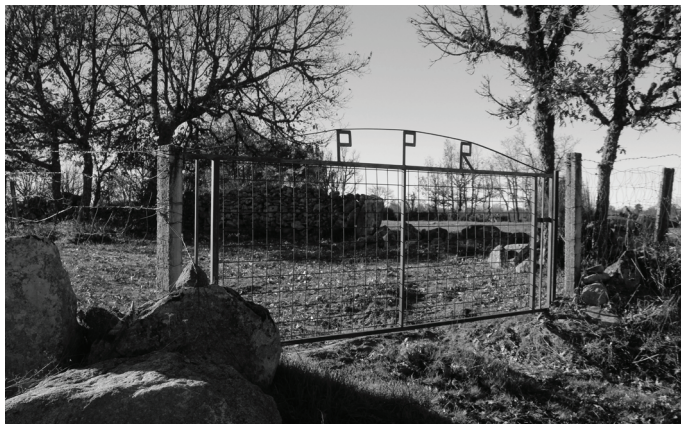
Fig. 5 – Paisagem Linguística Escrita com iniciais do proprietário.