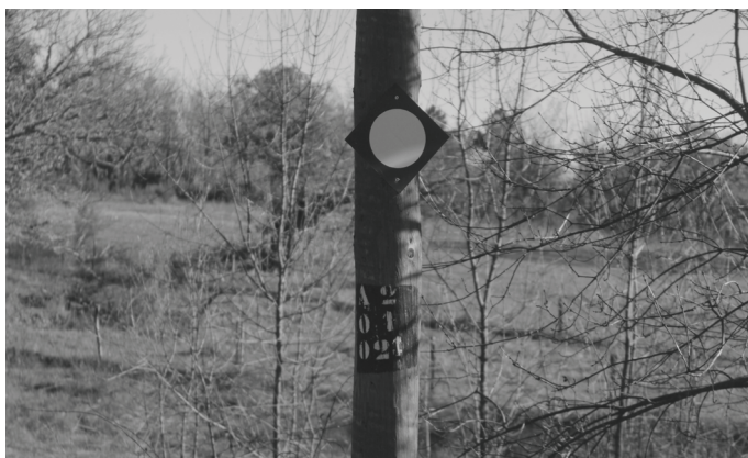
Fig. 6 – Paisagem Marcada por símbolos e sinais de caça.

conhecia a sua real posição, sendo, normalmente, seu o terreno vizinho. O informante conta histórias dessas que mereciam registo para compreender o quanto a posse da terra foi sempre fundamental, no passado, enquanto hoje tende a ser desvalorizada por quem não reside na aldeia porque quem por lá permanece nutre a mesma sensação da sua importância, continuando a terra a ser sinal de riqueza.