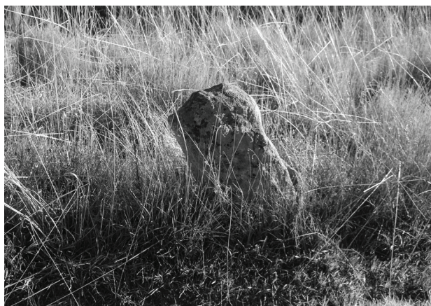
Fig. 7 – Um marco: sinal da divisão da propriedade.

território. Por exemplo, na Região Autónoma da Madeira, as populações preferem “sítio” (povoação um pouco maior a que se ligam “lugares”) e “lugar” (conjunto de casario pequeno, dependente do “sítio”), como parece ocorrer, igualmente, no Algarve, segundo informação recolhida há alguns anos. O termo “freguesia” é, no entanto, coincidente e emprega-se em qualquer lado. Todavia, estas questões de paisagem marcada, ou não, são comuns ao território português, seja ele continental ou arquipelágico. Os habitantes locais prescindem da linguagem verbal na paisagem porque a têm memorizada desde criança, já que a foram aprendendo e, deste modo, se diz, por exemplo, que aquela é “a casa da ti Ana” (a mãe de família) ou se fala na casa do “Manel da ti Ana” (mencionando a mãe para identificar o filho). Isso não está escrito em lado nenhum, mesmo se é sabido de cada um porque a identificação se faz pelo nome das pessoas e todos se conhecem uns aos outros, constituindo uma comunidade, o que explica a forma de tratamento por “tio” / “tia” ou “ti”. Quando já não conhecem os descendentes, estes interligam-se com os pais: “ser filho(a) de x” (o