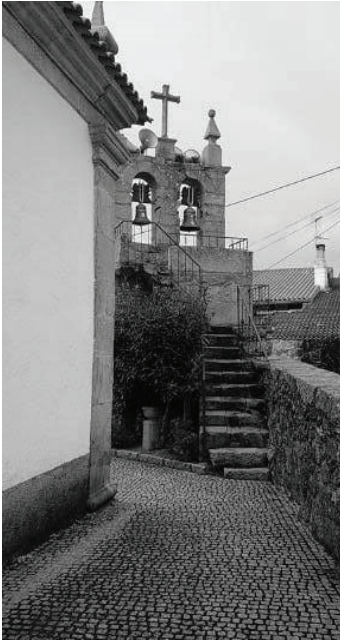
Fig. 8 – Campanário junto à igreja, no Cimo do Povo.

era essencial para ter água potável em casa e, antes dele, era-o a fonte, um recurso primitivo e essencial para a sobrevivência. Na época de veraneio, poderia acontecer que o chafariz secasse e, então, a fonte tornava-se essencial, inclusive para dar de beber ao gado, mas também para o consumo diário. Pode pensar-se que a água, sendo vital, é o centro da comunidade. Provavelmente por isso se ouve o ditado, “todos os caminhos vão dar à fonte”, que parece um decalque do famoso “todos os caminhos vão dar a Roma”. Conta o informante que, na fonte, antigamente, apanhavam a água “à tigela para pôr no cântaro” e levar para casa: ir à fonte durou até meados do século XX.