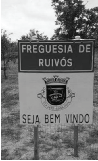
Fig. 3 – Placa toponímica a identificar Ruvívós e a dar as boas-vindas.

igualmente, visíveis símbolos e indicações específicas para caçadores vindos de fora (cf. Fig. 6)