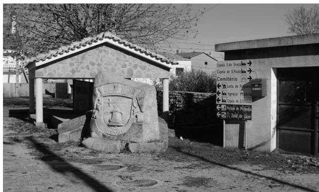
Fig. 4 – Paisagem Linguística Escrita em placas informativas no Largo da Fonte.

legando às mais novas. Todos sabem de quem são as casas e os terrenos: a propriedade privada. Nenhum habitante da aldeia tem necessidade de placas informativas. O mesmo sucede no todo nacional, inclusive nas ilhas. Além disso, como herança, para os campos, também existem os chamados “marcos” (cf. Fig. 7, pedras que assinalam as fronteiras, os limites dos terrenos) a delimitar a propriedade. Para quem era analfabeto, estes sinais eram suficientes e deviam ser respeitados, embora houvesse histórias de quem arrancasse os marcos para proveito próprio ou os desviasse sem avisar os interessados, alterando-lhes a localização, mas isso era imediatamente assinalado por quem