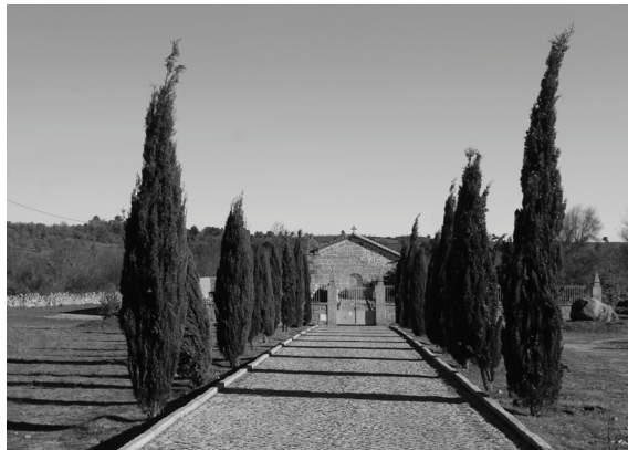
Fig. 9 – Entrada exterior do cemitério com caminho arborizado de ambos os lados.

fins específicos). Não servindo para o consumo, era onde as mulheres lavavam a roupa e conviviam um pouco, antes da construção em cimento destinada a esse fim (cf. Fig. 11). Hoje, está completamente seca, deixando de existir ali qualquer reservatório de água “presa”, o que terá acontecido há cerca de duas ou três décadas. O Largo da Fonte teve, no passado (cerca