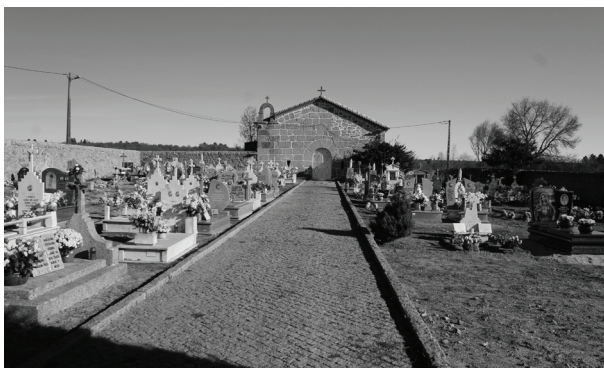
Fig. 10 – Entrada interior do cemitério após o portão. Fotografia de Jorge Torres (2020)

de trinta-quarenta anos), um forno comunitário e era também conhecido como o Largo do Forno, construção que, por deixar de ter utilidade para a comunidade, foi “deitada abaixo”, não havendo do forno qualquer vestígio, a não ser na toponímia oral (sem qualquer vertente escrita como se disse) que identifica em algumas famílias determinadas propriedades. O informante ainda situa uma casa como sendo a “casa do forno”, isto é, a casa de família que se localizava em frente ao forno comunitário, se bem que este já não exista. Portanto, o topónimo Largo do Forno, ainda da tradição oral, foi substituído por Largo da Fonte, que, com o passar dos anos, também poderá vir a ser apagado, quando a fonte deixar de ter valor comunitário. As vivências comunitárias, sociais e culturais, provocam alterações de hábitos que se manifestam a diversos níveis, inclusive linguísticos. É importante perguntar: Por que razão o forno comunitário deixou de ter utilidade e foi destruído? As explicações serão multicausais, mas uma leitura histórica possibilita observar que as mulheres ocuparam em grande medida o lugar dos homens emigrados, nas tarefas do campo, sobrando-lhes pouco tempo livre. Começou a surgir um padeiro (depois houve mais) que vinha vender pão (incluindo “pão espanhol” com formato específico), facilitando a tarefa às mulheres que, comprando-o, evitavam todo o trabalho do longo processo