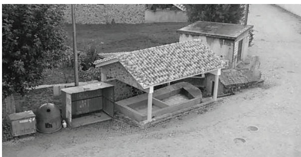
Fig. 11 – A fonte ladeada de um recente lavatório

de trinta-quarenta anos), um forno comunitário e era também conhecido como o Largo do Forno, construção que, por deixar de ter utilidade para a comunidade, foi “deitada abaixo”, não havendo do forno qualquer vestígio, a não ser na toponímia oral (sem qualquer vertente escrita como se disse) que identifica em algumas famílias determinadas propriedades. O informante ainda situa uma casa como sendo a “casa do forno”, isto é, a casa de família que se localizava em frente ao forno comunitário, se bem que este já não exista. Portanto, o topónimo Largo do Forno, ainda da tradição oral, foi substituído por Largo da Fonte, que, com o passar dos anos, também poderá vir a ser apagado, quando a fonte deixar de ter valor comunitário. As vivências comunitárias, sociais e culturais, provocam alterações de hábitos que se manifestam a diversos níveis, inclusive linguísticos. É importante perguntar: Por que razão o forno comunitário deixou de ter utilidade e foi destruído? As explicações serão multicausais, mas uma leitura histórica possibilita observar que as mulheres ocuparam em grande medida o lugar dos homens emigrados, nas tarefas do campo, sobrando-lhes pouco tempo livre. Começou a surgir um padeiro (depois houve mais) que vinha vender pão (incluindo “pão espanhol” com formato específico), facilitando a tarefa às mulheres que, comprando-o, evitavam todo o trabalho do longo processo