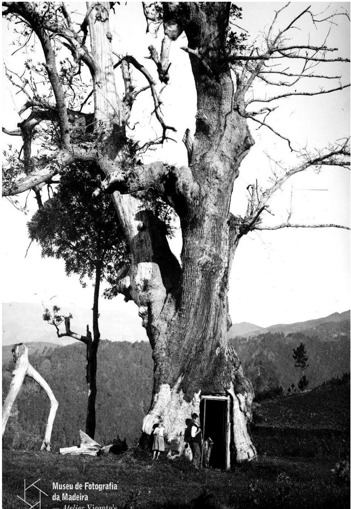
Figura 5. Castanheiro de grande dimensão da Achada de finais do séc. XIX/inícios do séc. XX.