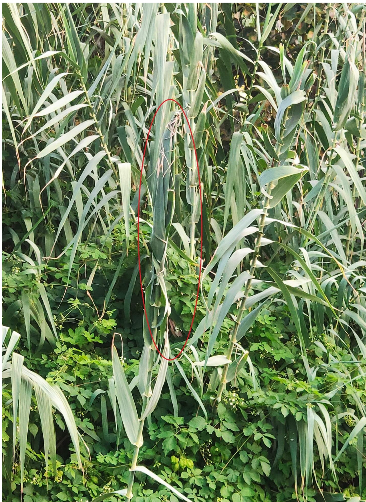
Figura 6. Canaveira entrançada da associação desportiva do Campanário de novembro de 2021