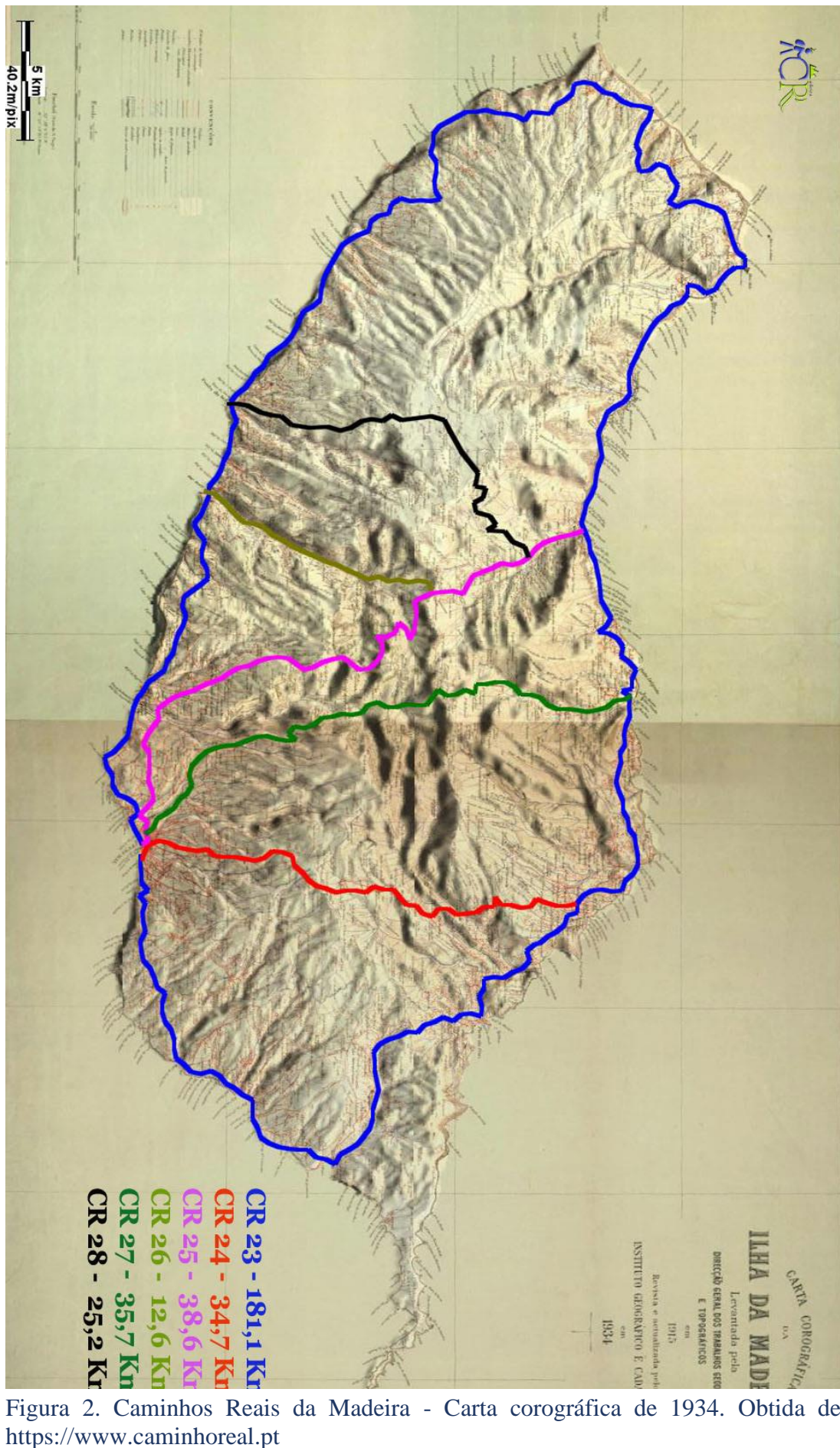
Figura 2. Caminhos Reais da Madeira - Carta corográfica de 1934.