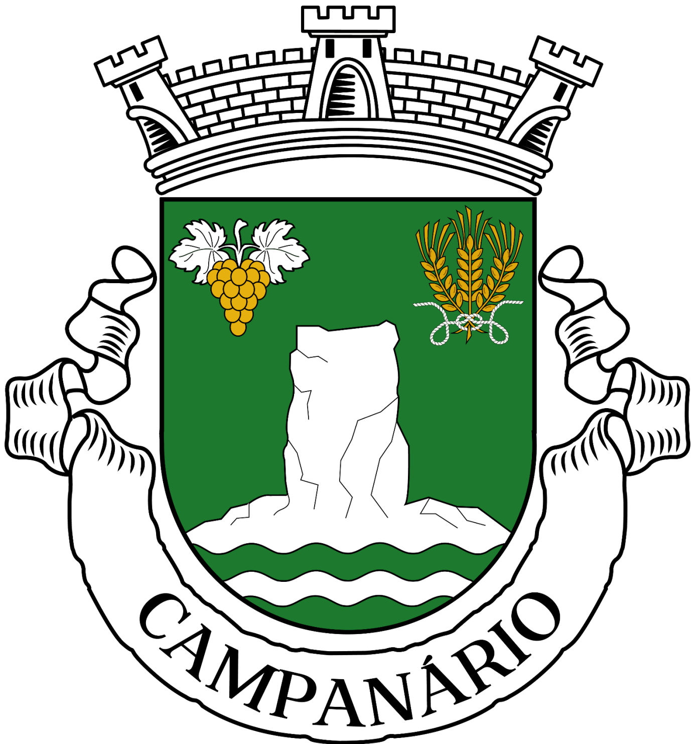
Figura 4. Heráldica representativa da freguesia de Campanário.