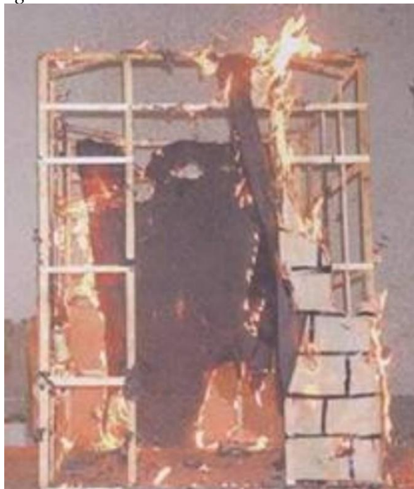
Notas: Fotografia do blog A Alrapa

O Combate dos Mouros, que servia de epílogo às solenidades, terminava formalmente com o “arder do castelo”. Mas o fogo que começava no solo prolongava-se pelo ar – como é tradição na maioria das festividades laicas e religiosas de Portugal – com cada vez mais vistosas sequências de fogo-de-artifício. A fim de trazer um pouco mais de alegria, diversão e colorido às festas de S. Bartolomeu – que saía em procissão nas manhãs de 24 de Agosto – as comissões de festas decidiram agregar ao evento outros atractivos tais como provas de ciclismo, concursos de pau ensebado, torneios de malha e exibições de ranchos folclóricos (com danças tradicionais da região), nos quais, curiosamente, se incluía um grupo de pauliteiros, que, aliás, parece ser único que há conhecimento nas últimas décadas em terras meridionais de Portugal.