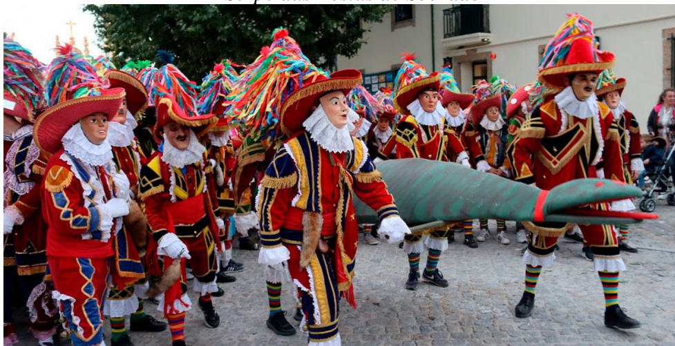
Notas: Foto da autoria de António Laginha

Numa terra de cara alegre e propositadamente engalanada para o efeito, desenrolam-se uma série de performances baseadas numa lenda, que se situa nos tempos da ocupação árabe das terras que correspondem hoje ao Norte de Portugal. Nessas representações teatrais sublinham-se quatro momentos principais: o encontro dos participantes, ao raiar do dia, o grande desfile antes do almoço, as arruadas a meio da tarde e, mais para o fim do dia, o auto, propriamente dito. Trata-se de representação dramática que encerra todas as festividades com a Dança do Santo no seu epílogo. Logo bem cedo, a concentração matinal dos Bugios (cristãos) é na casa da pessoa que desempenha o papel de Velho e, concomitantemente, a dos Mourisqueiros (infiéis), junto da casa do Reimoeiro. É em ambos os locais que se interpretam as primeiras danças de apresentação e só depois todos os envolvidos se deslocam para um edifício isolado e fora da povoação, a supracitada Casa do Bugio e do Mourisqueiro. Desde logo o Velho da Bugiada, que é a figura central de todo o enredo, e os seus companheiros, tentam evitar o grupo dos Mourisqueiros comandados pelo Reimoeiro, durante a refeição que se segue (curiosamente denominada “jantar”) e em que se começa a desenrolar a acção. Trata-se, segundo a tradição, de um banquete oferecido pelo rei mouro - que no sotaque nortenho se transforma em moeiro - ,