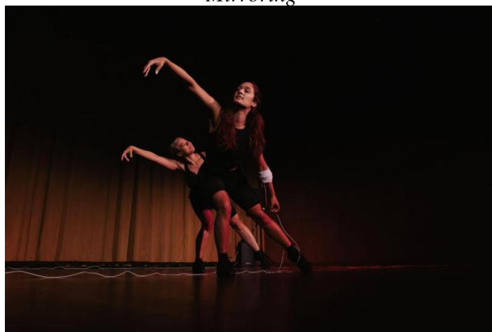
Notes: Photography by Abby Lee, with Antonella Garcia and Giselle Ruzany.

As someone with grown children Garcia's age, I felt responsible for becoming a safe base. For the second prompt, I relied on the attachment theory of psychology, where I offered support and parallel-mirrored her dance movements to connect and make her feel