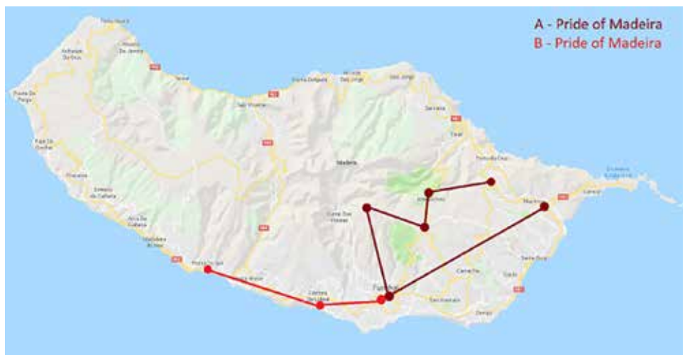
Figura 1. Itinerário turístico em Pride of Madeira, 1977.

b. (...) as they drove the seven kilometres back to Poiso. ‘There’s a small botanical garden at Ribeiro Frio, nothing like as formal as the one near Funchal” (p. 141)