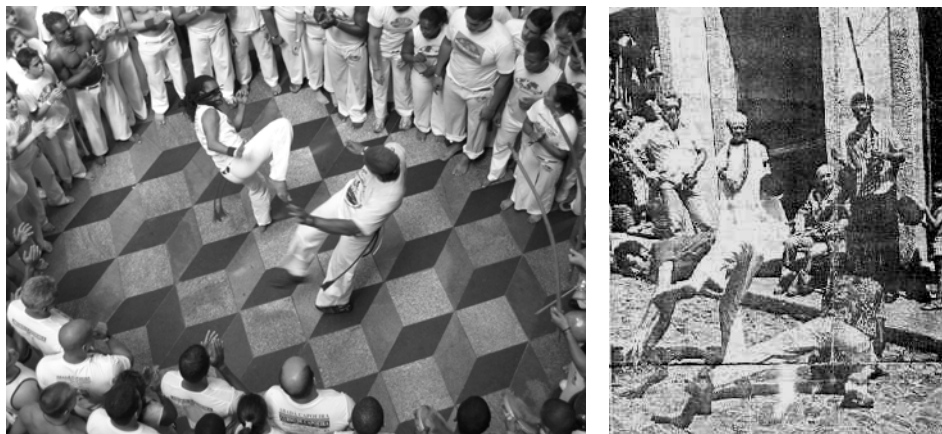
Figura 3 – Capoeira regional (esquerda) e angola (direita).

O mais interessante, é que pelo facto da capoeira ter passado da rua para a academia através de Mestre Bimba, também os praticantes de capoeira angola que pretendiam manter as tradições anteriores, acabaram por transferir a prática da mesma para dentro das academias, ou então seguindo simplesmente a via do abandono da prática da modalidade como refere Capoeira (2001, p.195): “While Bimba was creating his «revolution», the other capoeira players from Bahia, who started to be called «Angola» capoeira players (...) tried to adapt themselves to the new times, or they simply stopped practicing capoeira due to their disagreement with the changes that were happening.”