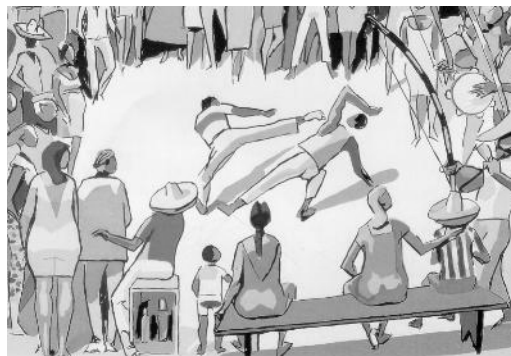
Figura 2 – Ilustração do pintor Carybe retratando a capoeira praticada na rua (2º período).

A capoeira mantinha a sua função principal de elemento de manutenção da identidade cultural, mantendo os seus desígnios de combate aplicados ao contexto da época, isto é, passando de instrumento de libertação de um regime de escravização, para um instrumento de sobrevivência numa sociedade marginalizante.