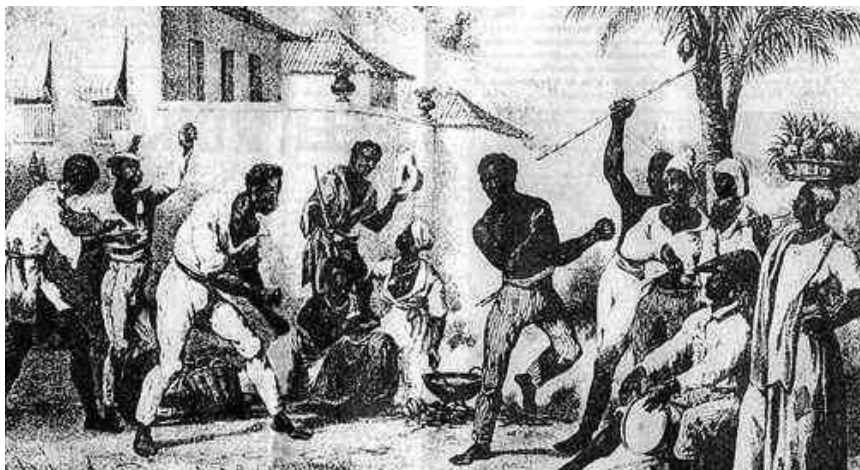
Figura 1 – Capoeira no 1º período: origem nas capoeiras, senzalas e quilombos.

Perante esta realidade “ por volta de 1814, a capoeira e outras expressões culturais negras começaram a ser reprimidas e perseguidas pelos senhores brancos ” (Capoeira, 2009. p.30), assim, “ diante dessa violência e na ânsia de liberdade, os negros, revoltados, fazem do seu próprio corpo a sua arma de defesa, utilizando-se de marradas, chutes e cabeçadas para conseguir fugir das garras do feitor, se escondendo na capoeira (vegetação rasteira que nasce nos campos depois de uma capina) ” (Sabiá, 2006, p.10) sugerindo, segundo este autor, a função combativa da capoeira através do próprio corpo, no que é suportado também por Assunção (2005) e D’Agostini (2004). Uma função onde se verificam objectivos reais, pois significavam o cativo (nas senzalas), a morte, ou a liberdade nos quilombos (mesmo que temporária). Podemos assim verificar na capoeira características predominantemente de combate (pelo menos na sua essência original), que se sobrepõem à vertente de dança (embora esta estivesse presente nas expressões culturais dos negros africanos).