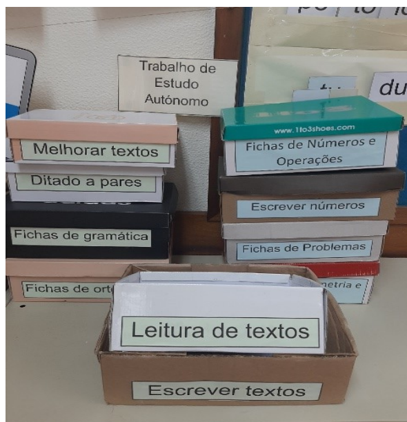
Figura 2 – “Cantinho” do TEA

Na sala de aula criou-se o “cantinho” do TEA, onde estavam disponíveis as caixas com os materiais (figura 2) que os alunos poderiam utilizar no dia e horário, previamente combinados: quartas-feiras entre as 8h30 e as 10h30 e sextas-feiras entre as 10h30 e as 12h30.