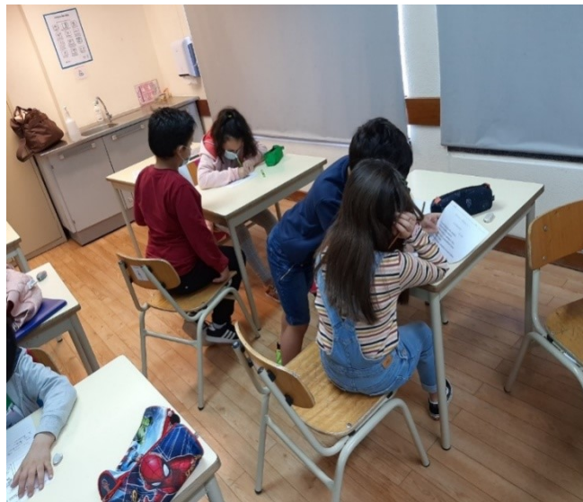
Figura 5 – Trabalho de pares

É de mencionar ainda que, inicialmente, o PIT era elaborado de forma individual. No entanto, havia uma atividade que era a escolhida por quase todos os alunos e a maioria das vezes, ou seja, “Ditado a pares” que era executada pelos alunos aos pares. Notou-se que eles escolhiam sempre esta tarefa e faziam-na com motivação e entusiasmo, pelo que a professora titular optou, posteriormente, por permitir que elaborassem todas as atividades aos pares. Isto porque manifestaram o gosto por se ajudarem uns aos outros, isto é, trabalhar em cooperação (figura 5).