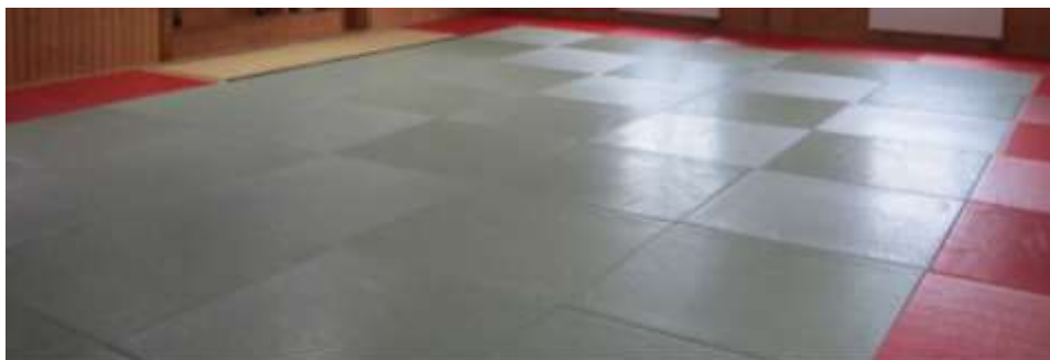
Imagem 3 – Tatami, tapete utilizado no Dojo