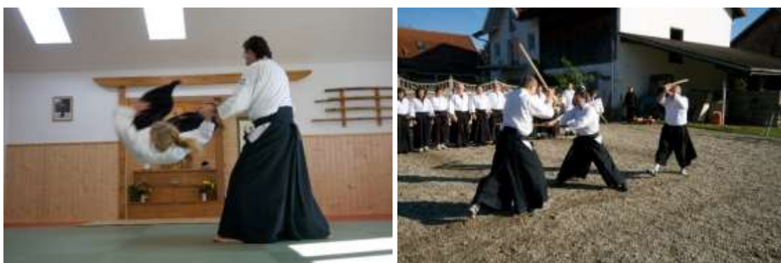
Imagens 1 e 2 – Exemplo de Dojo , interior e exterior

Como tal, e em como todas as academias e/ou organizações, existem “as etiquetas, cumprimentos e formalidades” que são cumpridas e que “devem ser encaradas como um sinal de respeito, devoção e humildade em relação à arte, ao instrutor Sensei e aos nossos colegas, criando um clima de paz tornando-os receptivos às lições do Dojo ” (Idem, p.8).