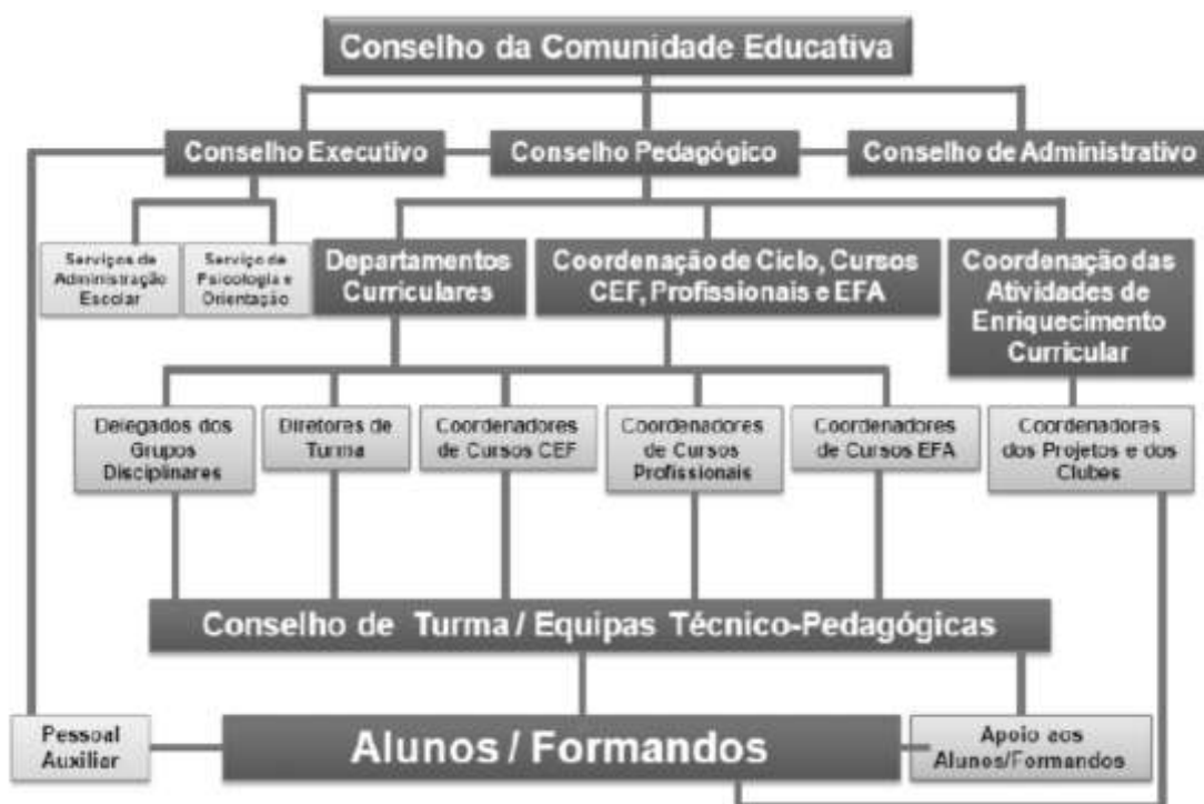
Figura 3 – Organograma da Escola em estudo

Pedagógico é composto pelo Presidente do mesmo, pelo Presidente do CE e pelo Presidente do CCE; têm ainda dois Representantes, sendo um deles Representante dos Orientadores de Estágio e outro Representante da Equipa de Autoavaliação e dos Documentos Educativos/Orientadores da Escola; uma Técnica do Serviço de Psicologia e Orientação e 6 Coordenadores, dos Departamentos de Línguas, de Expressões, de Ciências Sociais e Humanas, de Ciências Exatas e da Natureza e Tecnologias; de Educação Especial e das Tecnologias de Informação e Comunicação (TIC); 4 Coordenadores, sendo que um deles do 2.º ciclo, outro do 3.º ciclo, outro dos Cursos EFA e outro dos CEF; uma Coordenadora das Atividades de Enriquecimento e Complemento Curricular; uma Coordenadora do Projeto da sala multidisciplinar; uma Coordenadora do Desporto Escolar e uma Coordenadora da Comissão de Formação da Escola (PAE, 2016/2017, pp.13-15).