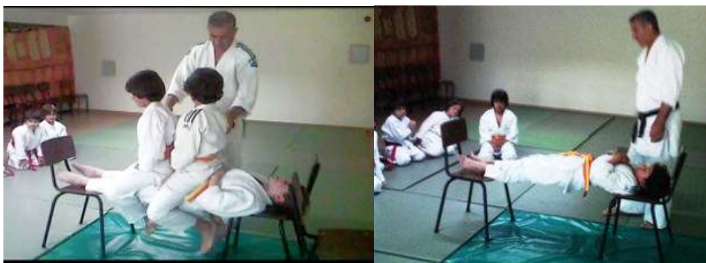
Imagens 6 e 7 – Exemplos de uma atividade realizada em coaching 7

Esta demonstração foi positiva e fez com que os alunos interessados participassem posteriormente da prática de Aikido, no dia e nas horas definidos, sendo os mesmos alvo de investigação.