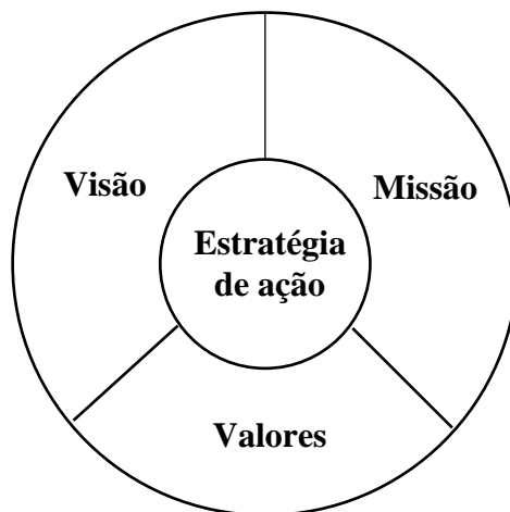
Figura 2 – Imagem da política da qualidade de uma organização