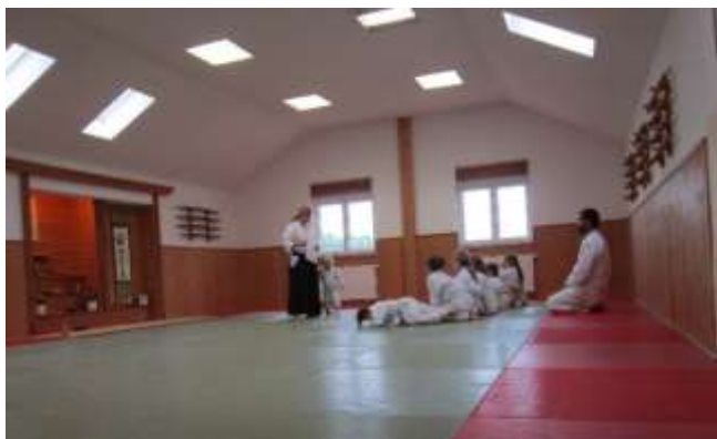
Imagem 4 – Formalidade inicial, antes do treinador se colocar de joelhos e de costas