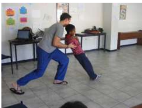
Imagem 8 – Exemplo de uma atividade realizada em coaching 8