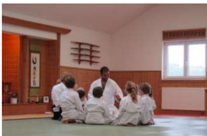
Imagem 5 – Círculo, cada um fala à vez (como se sente de 1 a 10)