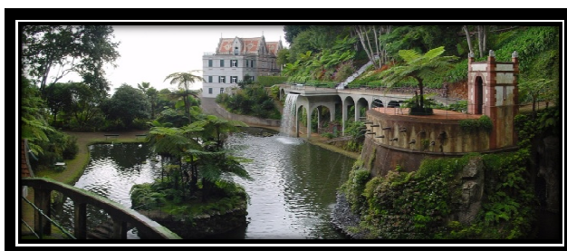
Figura 3 – Local da visita de estudo

A realização desta actividade foi justificada pelo intuito de promover o fortalecimento das relações entre os Professores, Alunos das Turmas leccionadas e seus Encarregados de Educação na procura de estilos de vida saudáveis e de sensibilização e preservação da natureza. Com este encontro pretendíamos também, que a interacção resultasse num desenvolvimento dos laços afectivos entre os elementos das Turmas presentes.