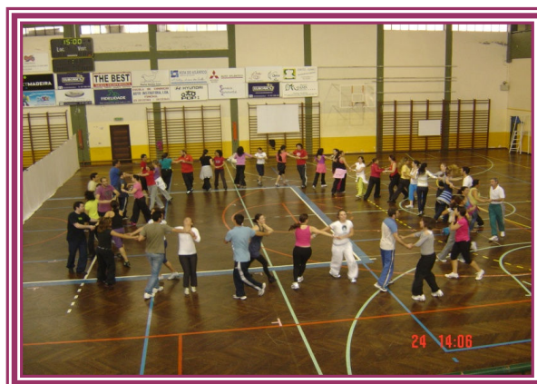
Figura 4 – “A Dança na Escola”

Como pudemos verificar no decorrer da acção a adesão à componente prática foi bastante positiva, havendo apenas dois participantes que não a realizaram, contudo assistiram à totalidade da mesma. Este elevado número de participantes poderá indicar a grande abertura que os Profissionais de Educação Física possuem para enriquecer a sua formação nesta área, apontando inclusive para a necessidade da continuação de acções deste género num futuro próximo.