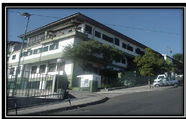
Figura 1 – O Edifício da Escola

Ao nível do 2º e 3º ciclo, mensalmente são realizadas reuniões de Coordenação Pedagógica para promover a comunicação entre os Professores de cada Turma, com o objectivo de debater sobre as necessidades educativas e desenvolver estratégias que promovam o sucesso escolar dos Alunos.