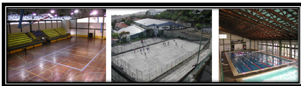
Figura 2 – Instalações desportivas

Existe uma rotação dos espaços pelos Professores com duração de um período, sendo que a Turma leccionada por nós teve a piscina disponível às segundas-feiras, durante todo o ano lectivo, um campo do pavilhão gimnodesportivo às quintas-feiras, durante dois períodos escolares e um campo exterior, durante um período.