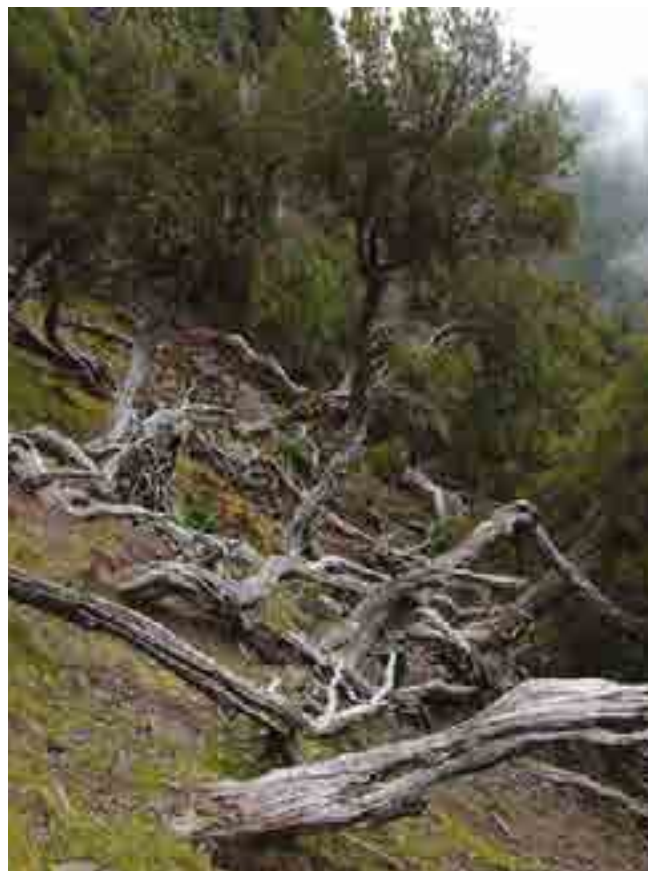
FIGURA 5 Urzal de altitude, Polysticho falcinelli - Ericetum maderensis , perto do pico Ruivo.

Um outro tipo de vegetação notável do arquipélago da Madeira é a vegetação aero-halófila das arribas marítimas, ou seja, a vegetação que, para além de outros fatores concomitantes, como a elevada secura ou a presença de nitratos com origem nos dejetos de aves, sofre a influência permanente dos ventos marinhos carregados de sal (salsugem). Estas comunidades ocorrem na parte mais oriental da ilha da Madeira, a ponta de São Lourenço, e no Porto Santo, nas plataformas com solo sobranceiras às arribas marítimas. São geralmente compostas por Argyranthemum pinnatifidum subsp. succulentum , Lotus glaucus subsp. glaucus , Atriplex glauca subsp. ifnensis e Calendula maderensis , denominando-se