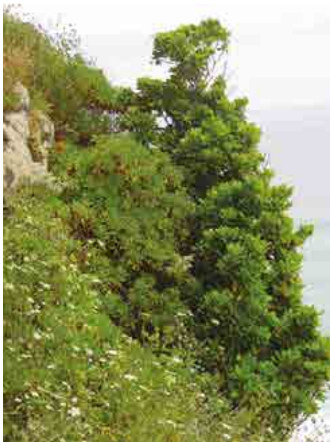
FIGURA 6 Comunidade de marmulano, Helichryso melaleuci-Sideroxyletum marmulanae , junto a Porto da Cruz.

assumimos que nos andares bioclimáticos homólogos pudesse ter havido comunidades florestais potenciais similares às da ilha da Madeira. No que respeita às comunidades azonais, os endemismos do Porto Santo definem combinações originais de plantas e, como tal, tipos de vegetação endêmicos dessa ilha. Quanto à vegetação serial, existe alguma distinção nas combinações das comunidades homólogas com a Madeira, já que os andares térmicos do Porto Santo correspondem a andares ômbricos de maior aridez. Os tipos de vegetação arbustiva, possivelmente subserial de uma floresta primitiva de zambujeiro ( Olea maderensis ) com dragoeiros ( Dracaena draco ), são dois: um primeiro dominado pela figueira-do-inferno ( Gennario diphyllae-Euphorbietum piscatoriae ) e um segundo ( Sideritido multiflorae-Echietum portosanctensis ) dominado pelo massaroco ( Echium portosanctense ).