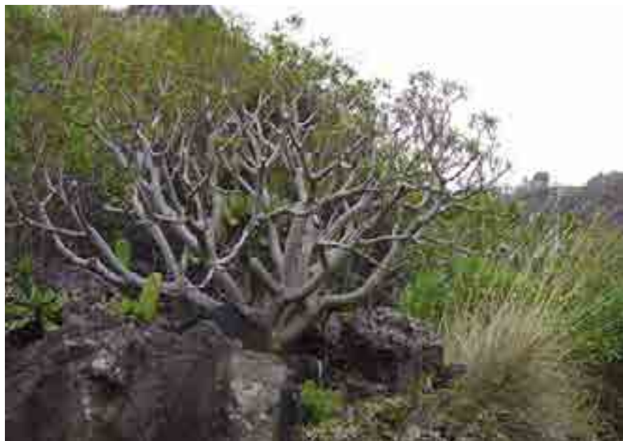
FIGURA 3 Comunidade arbustiva com figueira-do-inferno, Euphorbia piscatoria .

anteriores, as comunidades correspondentes à série da laurissilva do barbusano desenvolvem-se em áreas que foram sujeitas a uma destruição massiva da floresta, primeiro num característico «corte e queimada» para cultivo de cereais, rapidamente substituídos pela cultura da cana-de-açúcar, que terá levado ao desaparecimento de dezenas de milhares de hectares de floresta como fonte de energia para os engenhos de açúcar. Na história agrícola da Madeira segue-se a expansão do cultivo da vinha, em consequência da erosão e esgotamento dos solos necessários ao cultivo da cana, assim como da escassez da matéria lenhosa necessária para alimentar os engenhos de açúcar. A utilização agrícola atual do território beneficia da expansão, a partir da segunda metade do século xx, da rede de levadas que possibilitaram a conversão das culturas de sequeiro características da paisagem agrícola primitiva em culturas de regadio, permitindo o cultivo da batata, de hortícolas diversas e de árvores de fruto de origem tropical ou subtropical, como o abacateiro, os mangueiros e a anoneira.