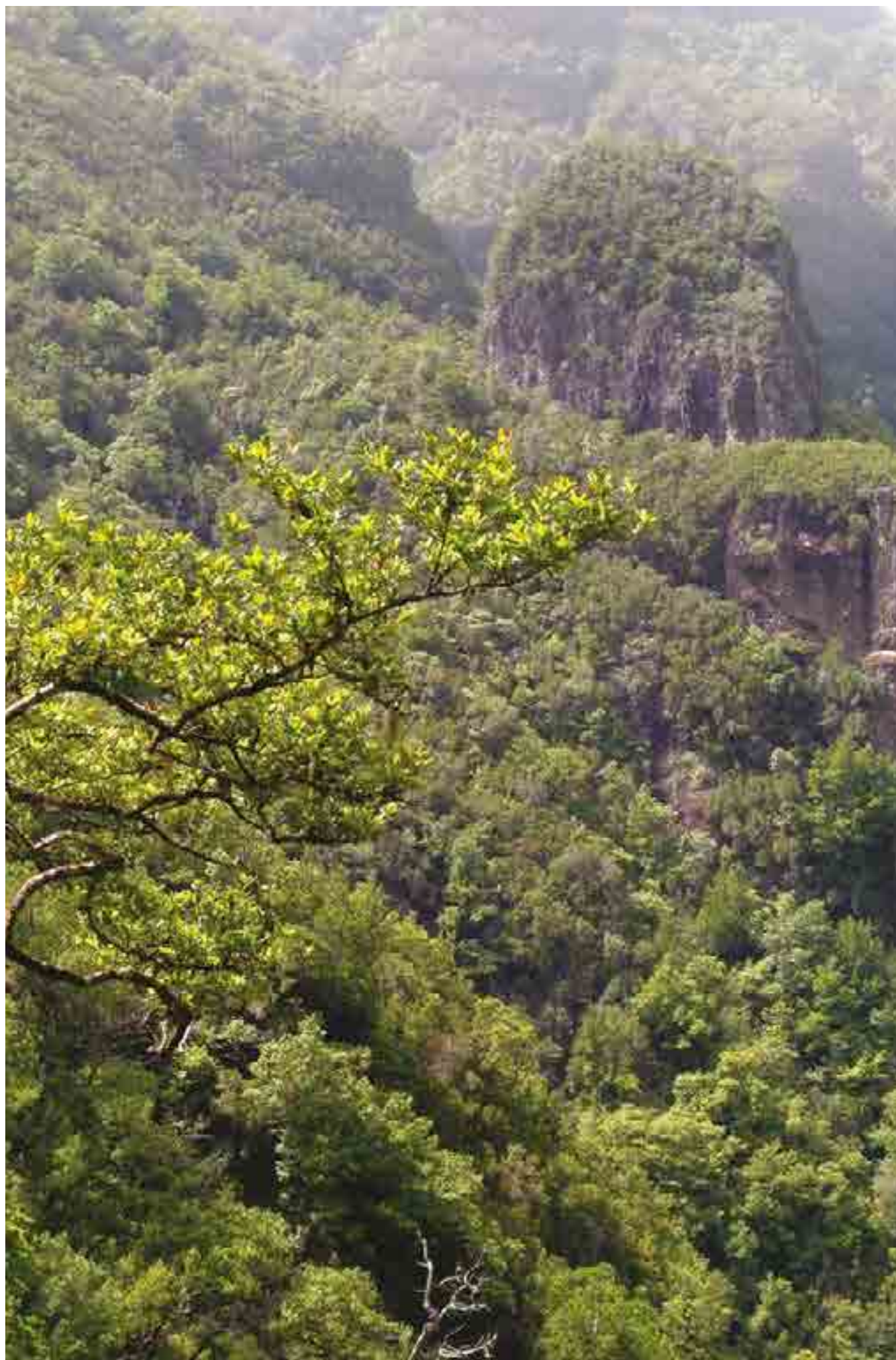
FIGURA 4 Laurissilva dotil, Clethro arboreae- -Ocoteetum foetentis, no vale da ribeira do Seixal.