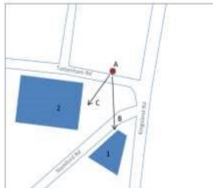
Fig. 1 - Localização geográfica da filmagem de The Girl Chewing Gum , de John Smith, em Londres

O filme é formado por dois planos-sequência, que correspondem a dois locais em Londres, separados entre si por 15 milhas (como diz o realizador, em voz-off). A primeira sequência começa com um plano estático tomado desde a rua Tottenham e “olhando” para um prédio na rua Stamford, em Dalston, Londres (figura 1) 4 . No mapa o n.º 1 corresponde ao prédio que vemos no início do filme e que é alvo do ponto de vista B durante os primeiros 8 minutos do filme. O ponto de vista C ocorre aos 8 minutos, quando uma panorâmica muda de enquadramento e agora aponta para a entrada do Cinema Odéon Dalston , representado pelo n.º 2 (sala de espetáculos demolida poucos anos após a realização do filme).