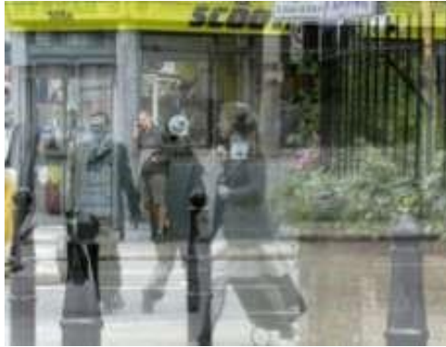
Fig. 6 - The Man Phoning Mum , 2011. Sobreposição de filmagens.

Ao filme original é sobreposta uma nova filmagem (figura 6) que, por efeito de transparência, combina as imagens do passado, a preto e branco, com as do presente permitindo, como refere o próprio autor, encontros furtivos dos transeuntes de ontem de hoje no mesmo espaço, 35 anos depois. A nova imagem, colorida e de alta qualidade, contrasta com a original apesar de ser tão banal, enquanto material pró-fílmico, como o foi a original no seu tempo. O som que ouvimos nesta amálgama de imagens é apenas o da versão original de 1976.