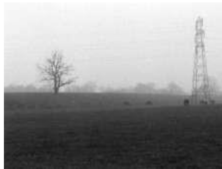
Fig. 5 - Plano-sequência n 2º. Panorâmica horizontal para a esquerda em 360º

Finalmente, quase aos 10 minutos, um zoom out abre o plano da rua ao máximo, como ainda não tinha sido vista, e o plano já não contém qualquer discurso do autor, nem som ambiente. Logo em seguida, através de um corte abrupto é nos dado a ver o campo de que antes o narrador falava (figura 5). Este segundo e último plano-sequência é uma panorâmica contínua à esquerda, de 360 graus, que nos mostra um campo aberto e um céu enevoado. Vemos um poste de eletricidade, cavalos no pasto, arbustos e árvores e, desta vez, contrariando a lógica, ouvimos o som da rua, em Dalston, e o alarme de roubo, de novo.