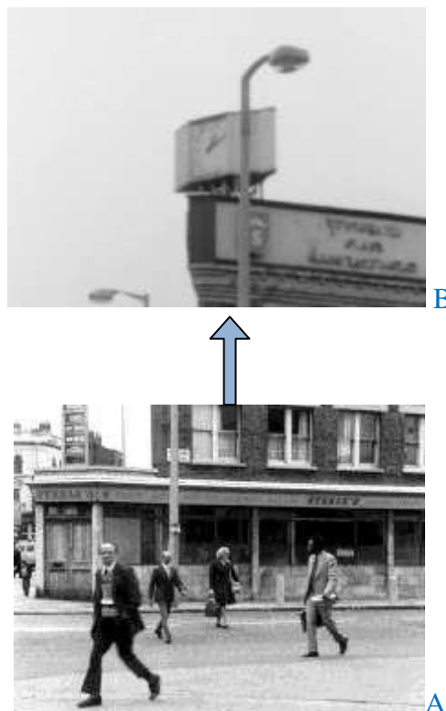
Fig. 2 - Panorâmica vertical ascendente, para o relógio.

Aos 2’ este plano fixo evolui para uma panorâmica vertical ascendente (figura 2), após o realizador ordenar que a rua, o edifício e as pessoas se “afundem”: « Right. Now I want everything to sink slowly down as the five boys come by...hold it. ». Esta curiosa frase do autor contrasta com a habitual instrução técnica no cinema, que consiste em solicitar um movimento ascendente de panorâmica, ou seja, de inclinar progressivamente a câmara para cima. O facto de John Smith pedir que o prédio e a rua se “afundem”, começa a exercer no espetador um corte na lógica diegética que tinha sido convencionada nos primeiros minutos.