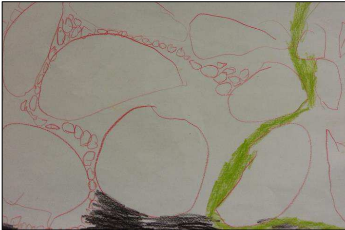
Figura 2. Desenho sobre as atividades que gostam de realizar no recreio. “A boa na ua, as patiaas” [jogar à bola na rua com as sapatilhas] (David, 3 anos).

isso a possibilidade de se relacionar com referências culturais e sociais. Brincar livremente no exterior só é desejável num tempo controlado daí ser tão almejado pelas crianças, sobretudo pelas mais novas, ávidas de ação lúdica pura como se pode ver na Figura 2.