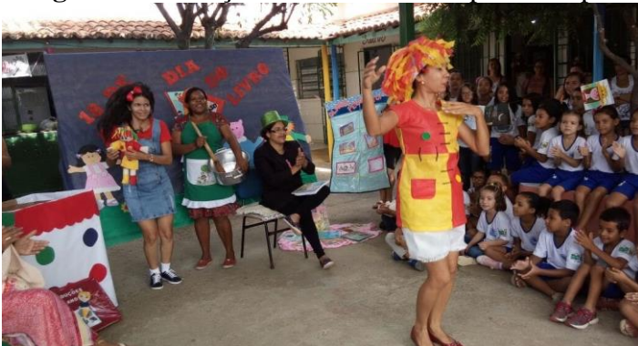
Imagem 5. Utilização das artes cênicas para interpretação de obras.