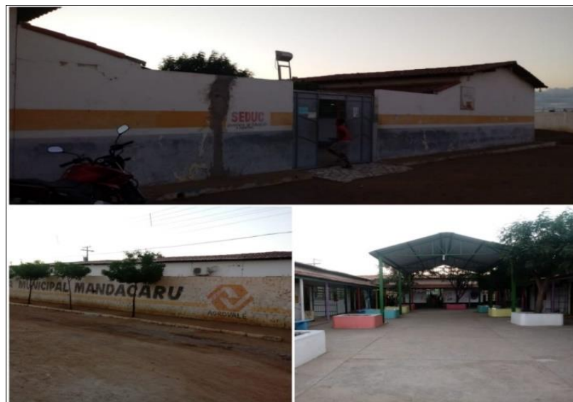
Imagem 2. Escola Mandacaru, local de aplicação do presente trabalho.

O bairro Jardim Primavera fica distante, 12 km, do centro da cidade de Juazeiro-Bahia, no Brasil e seus residentes consistem em pessoas de renda média baixa, em sua maioria, trabalhadores rurais, migrantes de outros municípios, com uma vasta lista de reivindicações sociais por melhorias na qualidade de vida, por não possuir praticamente nenhuma infraestrutura, como saneamento, pavimentação, enfim, é um bairro com condições precárias de sobrevivência.