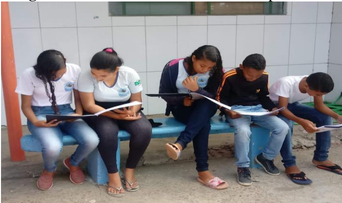
Imagem 4. Alunos realizando leituras no período de intervalo entre as aulas.

Exatamente nesse ponto, confrontamos o conceito de inovação escolar com a prática estabelecida na escola pesquisada, desde a experiência da professora que aplicou o projeto sugerido, com uma metodologia motivadora, estimulando a participação de seus alunos com aulas dinâmicas e variadas, saindo algumas vezes da escola e explorando outros universos, para, a partir daí motivar a turma a ler e escrever mais. Propostas de inovação realizadas pela pesquisa: leituras nos horários vagos e nos intervalos entre as aulas (Imagem 4); utilização das artes cênicas para interpretação de obras (Imagem 5).