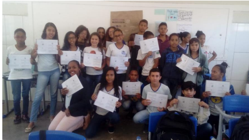
Imagem 03. A turma dos sujeitos da pesquisa