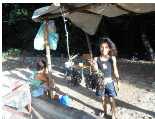
Figura 7 - Indígena vendendo caranguejo

No que diz respeito à Educação para sobrevivência, a pescaria e a captura do caranguejo no mangue são algumas das modalidades importantes. Os filhos e as filhas acompanham os pais nestes trabalhos, em face da difícil luta pela sobrevivência.