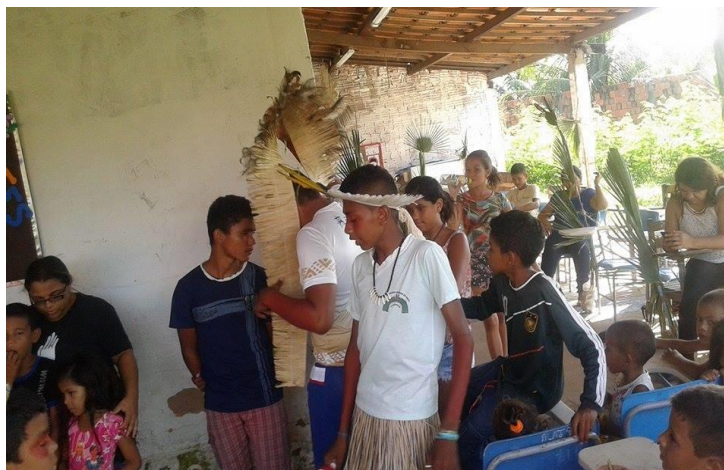
Figura 6–Descendentes dos Tapebas

Em face do exposto e considerando-se as variáveis hereditárias, alimentares, culturais e ambientais, evidencia-se que os alunos da Escola Diferenciada Indígena da Ponte que descendem diretamente dos índios Tapeba denotam tipologias biotipológicas similares às de seus ancestrais.