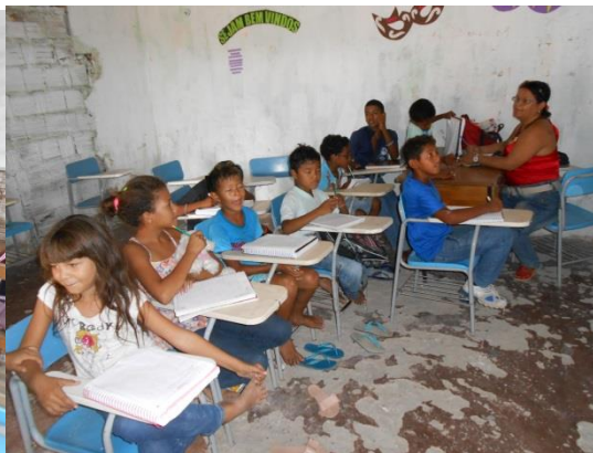
Figura 19 - Sala de Aula