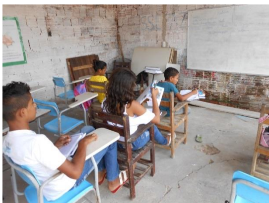
Figura 18 - Sala de Aula