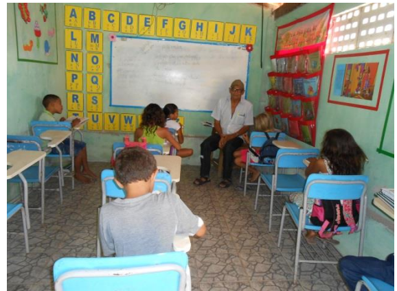
Figura 12 - Sala de Aula