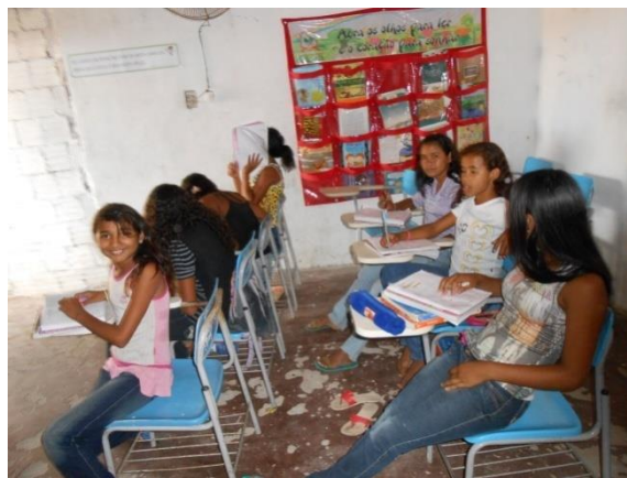
Figura 17 - Sala de Aula

No prédio II, denominado de anexo, estão instaladas: - 03 (três) salas de aulas; - instalações sanitárias para os alunos dos sexos masculino e feminino; - um alpendre que serve para as reuniões de pais, planejamento dos professores e é utilizado, também, como sala de aula.