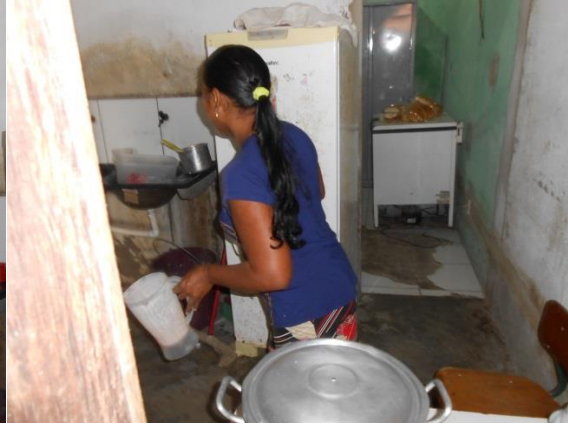
Figura 15 - Cozinha da Merenda Escolar