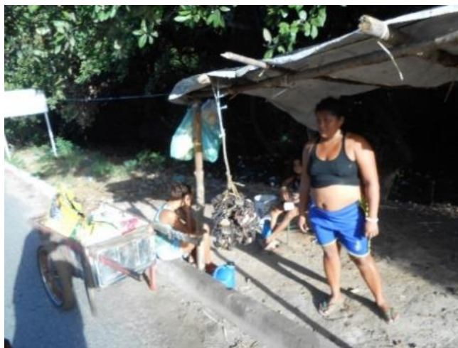
Figura 3 - Indígena vendendo caranguejo

Essas crianças e adolescentes são facilmente vistas, nos finais de semanas, vendendo caranguejos às pessoas que por lá trafegam nos seus carros em direção às praias. Estas vendas garantem a sobrevivência de si e da sua família, que eles, juntamente com os pais, retiram do mangue, localizado às margens da BR-222.