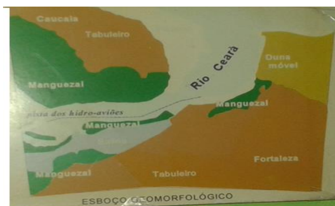
Figura 2. Região do rio Ceará, onde estão os Tapebas

Os alunos que estudam na Escola Indígena da Ponte, local onde se realizou a pesquisa, na maioria, são descendentes da aldeia dos índios Tapebas, mais conhecida como Comunidade Indígena da Ponte II, que está localizada em ambos os lados, direito e esquerdo, da Rodovia Federal, BR. 222, que liga Fortaleza à zona norte do Estado do Ceará.