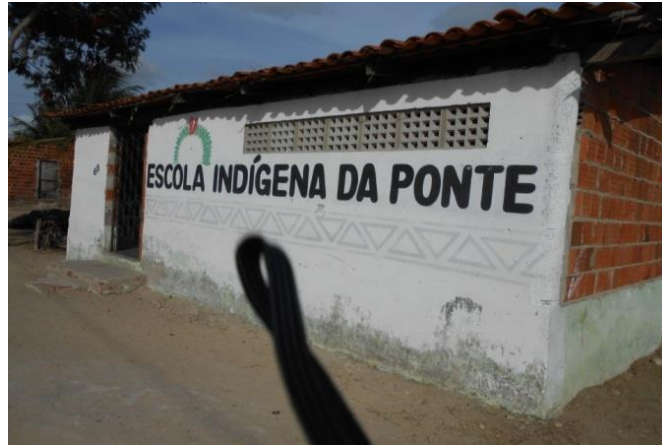
Figura 10 - Prédio I