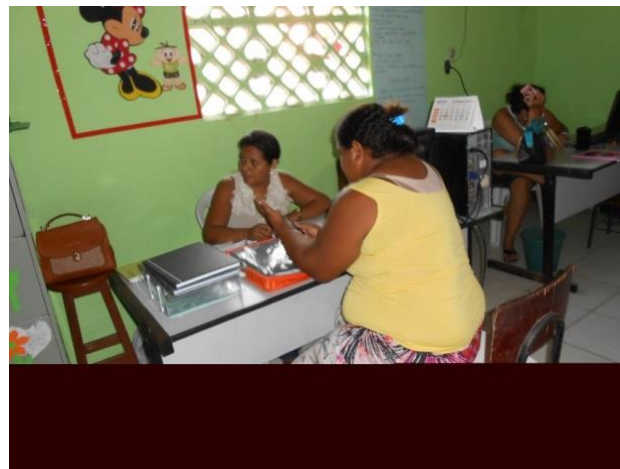
Figura 13 - Diretoria/Secretaria