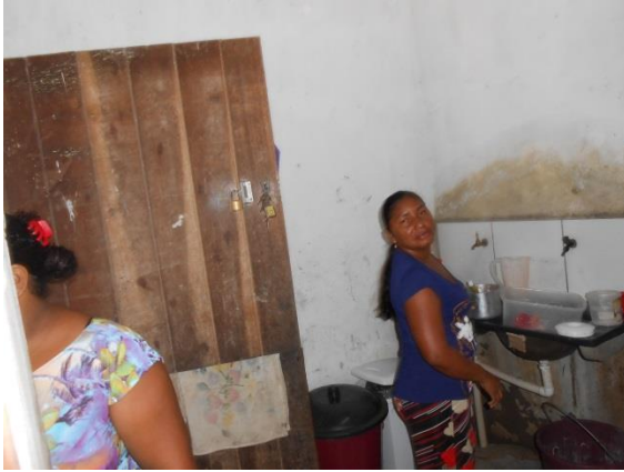
Figuras 14 - Copa