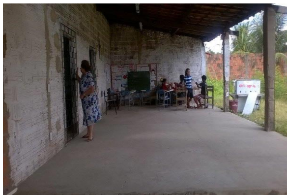
Figura 20 - Salão para reuniões

A organização dos turnos dedicados às aulas, na Escola Diferenciada Indígena da Ponte, ocorre em dois períodos: manhã e tarde. A gestão da escola conta com os seguintes participantes da Educação Escolar: 138 alunos, 13 professores, Núcleo Gestor constituído pela Diretora Geral, Coordenadora Pedagógica, Secretária, Administração Financeira, Merendeira, Auxiliar de serviços gerais, e 02 (dois) vigilantes.