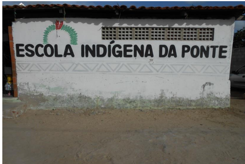
Figura 16 - Prédio II

No prédio II, denominado de anexo, estão instaladas: - 03 (três) salas de aulas; - instalações sanitárias para os alunos dos sexos masculino e feminino; - um alpendre que serve para as reuniões de pais, planejamento dos professores e é utilizado, também, como sala de aula.