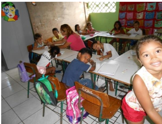
Figura 11 - Sala de Aula