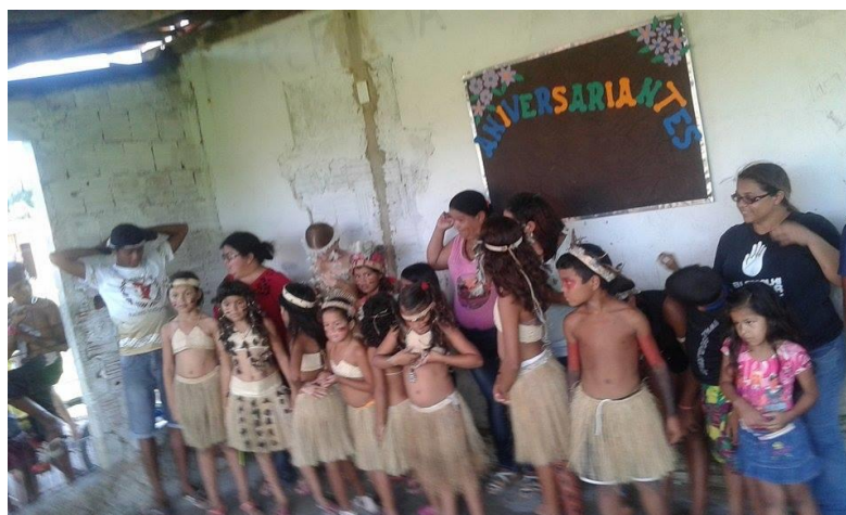
Figura 5 - Descendentes dos Tapebas

Os dados relatados relativos aos aspectos éticos presumem-se que devem estar agregados aos hábitos alimentares e ao estilo de vida adotado pela população. Estes hábitos indicam variáveis direcionadas à população indígena brasileira nas diversas etnias, levando-se em consideração os aspectos culturais, uma vez que os padrões culturais interferem de certa forma nas características morfológicas.