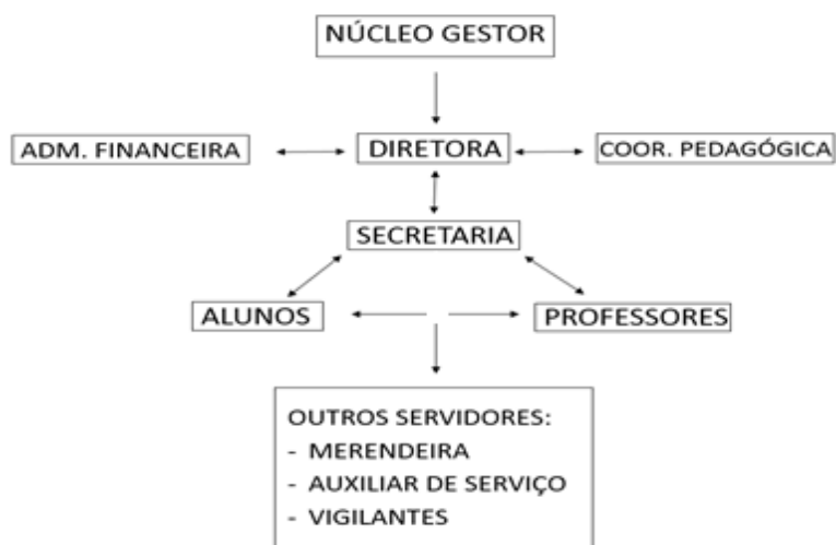
Figura 9 - Organograma da Escola

No que concerne à organização a Escola Diferenciada Indígena da Ponte, funciona em dois períodos: manhã e tarde. Conta com os seguintes sujeitos participantes da educação escolar: 138 alunos, 13 professores, o Núcleo Gestor: constituído de Diretora Geral, Coordenadora Pedagógica, Secretária, Administração Financeira, Merendeira, Auxiliar de Serviços Gerais, e 02 (dois) Vigilantes, conforme Organograma a seguir.