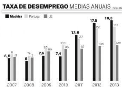
Quadro 9. Taxa de desemprego - médias anuais.