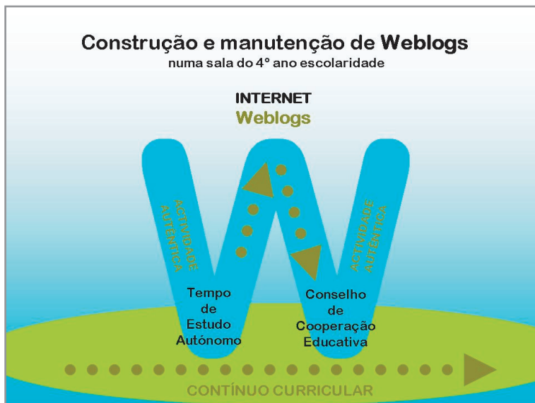
Figura 2- A construção e a manutenção de weblogs numa sala de 4º Ano de Escolaridade

A acção dos alunos na construção e manutenção de Weblogs , na sala de aula do 4º Ano de Escolaridade foi enquadrada no Tempo de Estudo Autónomo, conforme de pode ver na figura seguinte: