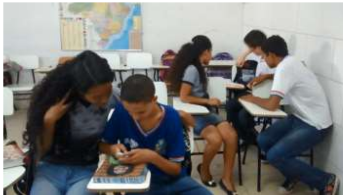
Figura 15 –Cena do curta-metragem.