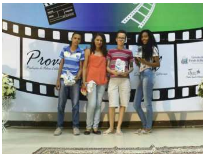
Figura 02 – Alunos da Escola Padre Alfredo Haasler no auditório do colégio Gilberto Dias de Miranda