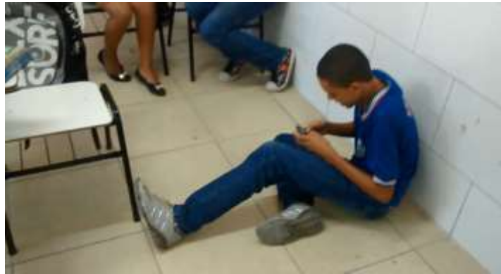
Figura 18 –Cena do curta-metragem.