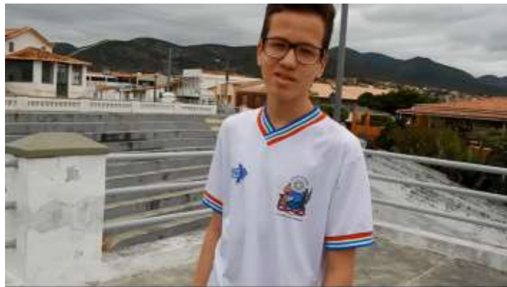
Figura 19 – Cena do curta-metragem.