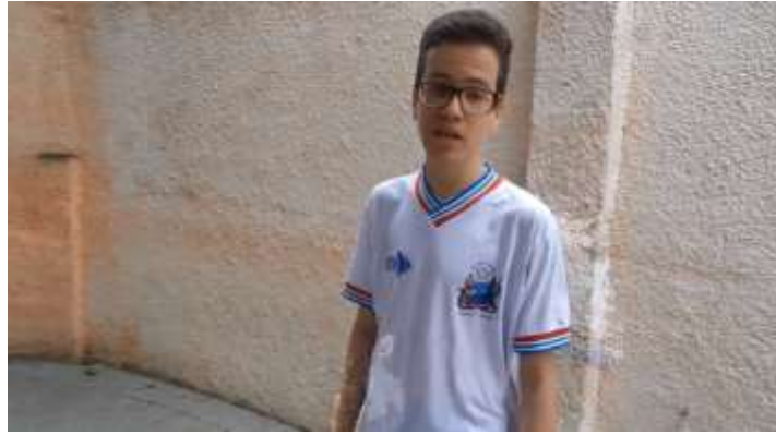
Figura 09 –Cena do curta-metragem.

Esse aluno encontra duas colegas sentadas embaixo de uma árvore utilizando cada uma um aparelho celular. Ele tenta chamar a atenção das colegas, mas não obteve sucesso.