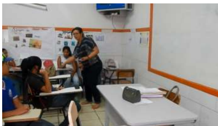
Figura 12 –Cena do curta-metragem.

Ele aproveita para mostrar como o aparelho é utilizado pedagogicamente na aula, no entanto, a professora recolhe os telefones dos alunos e diz: “nada de celular, vamos anotar.” e se dirige à lousa.