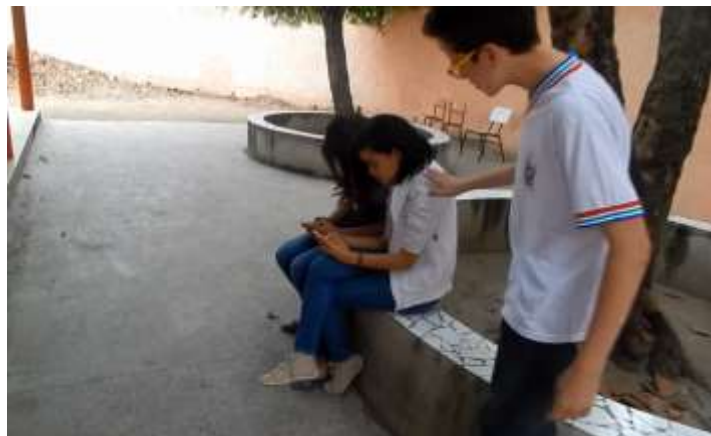
Figura 10 –Cena do curta-metragem.

Esse aluno encontra duas colegas sentadas embaixo de uma árvore utilizando cada uma um aparelho celular. Ele tenta chamar a atenção das colegas, mas não obteve sucesso.