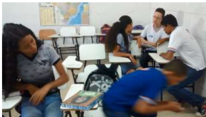
Figura 16 –Cena do curta-metragem.