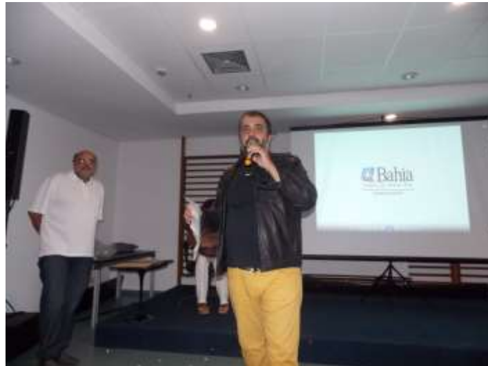
Figura 06 – Corpo de Jurados na Etapa Final do Prove.

“A ideia é tudo e para fazer cinema à coisa mais importante é ler, e a base de tudo é a ideia que vai ser contada, criar é sempre acender a pólvora de um pavio da historia é aquele que quer brincar de Deus, criar historia desperta medo e terror.”.