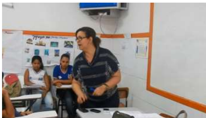
Figura 13 –Cena do curta-metragem.

Posteriormente, é apresentada uma cena em que uma aluna tenta chamar a atenção de um colega, porém ele está tão entretido com o aparelho