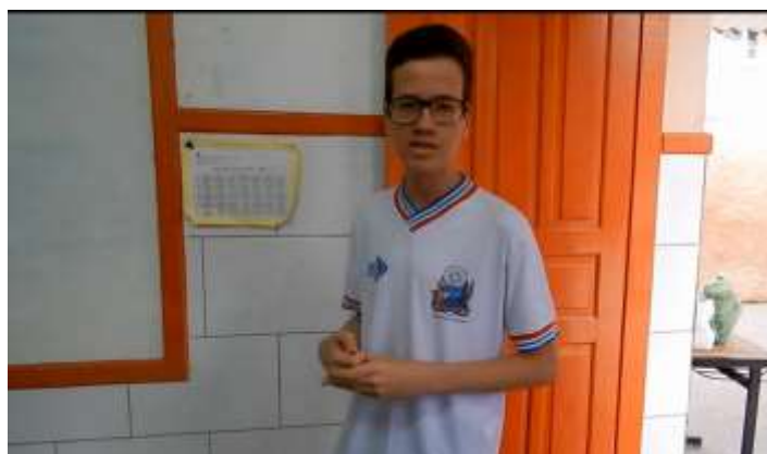
Figura 11 –Cena do curta-metragem.

Ele aproveita para mostrar como o aparelho é utilizado pedagogicamente na aula, no entanto, a professora recolhe os telefones dos alunos e diz: “nada de celular, vamos anotar.” e se dirige à lousa.