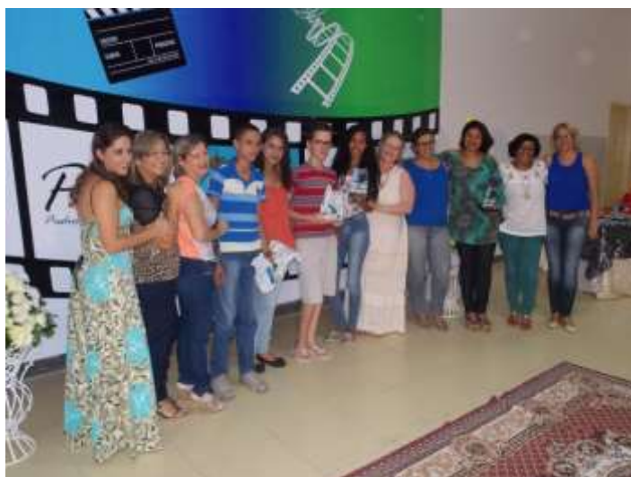
Figura 03 – Alunos da Escola Padre Alfredo Haasler e Professoras da Rede Estadual da Bahia no auditório do Colégio Gilberto Dias de Miranda.