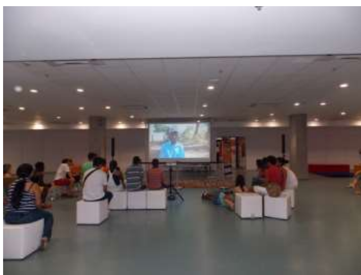
Figura 05 – Público assistindo aos curtas.

O Prove é uma mistura de arte cinema, educação e cultura. Com celulares, câmeras fotográficas os alunos fazem dessa experiência o trabalho com filmagem. São os novos discípulos do Cineasta Glauber Rocha, 874 escolas participaram da 2ª mostra do Prove, nessa etapa foram exibidos 15 curta-metragem de 5 minutos, fazem arte livre pessoas e lugares são diferenciados e protagonizados através da arte. Para José Araripe um dos jurados: