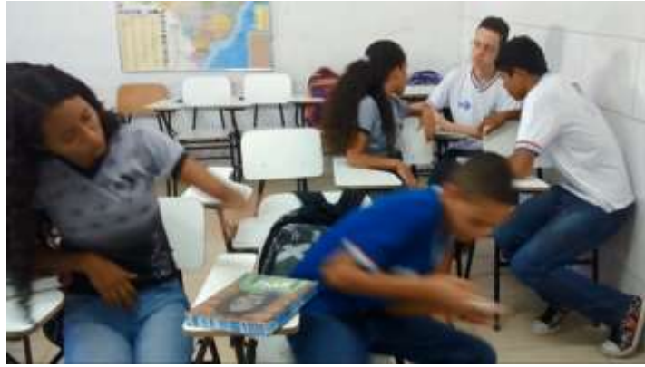
Figura 17 –Cena do curta-metragem.