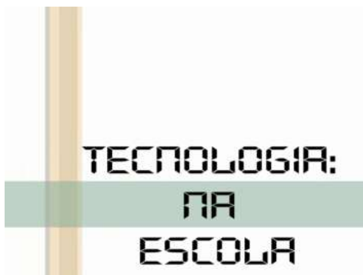
Figura 08 –Apresentação e título do curta-metragem

O curta-metragem intitulado “As tecnologias na escola” é o nosso tema gerador no qual aborda as vantagens e desvantagens da tecnologia na escola e em nossas vidas, obteve a classificação da terceira colocação na etapa regional, mostra de maneira categórica a capacidade de produção efetiva desses alunos ao líder com as novas tecnologias de forma lúdica tendo o professor apenas como monitor e colaborador sendo eles próprios os mentores, produtores e atores desse conhecimento.