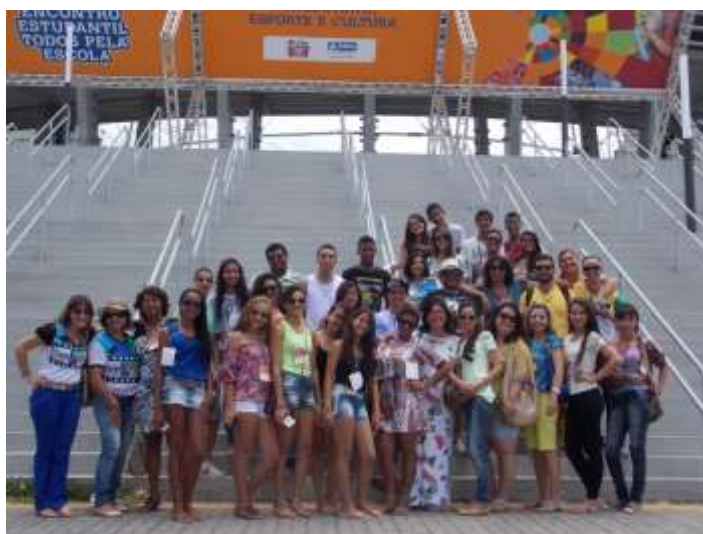
Figura 04 – Alunos da Rede Estadual da Bahia em frente à Arena Fonte Nova, em Salvador-BA