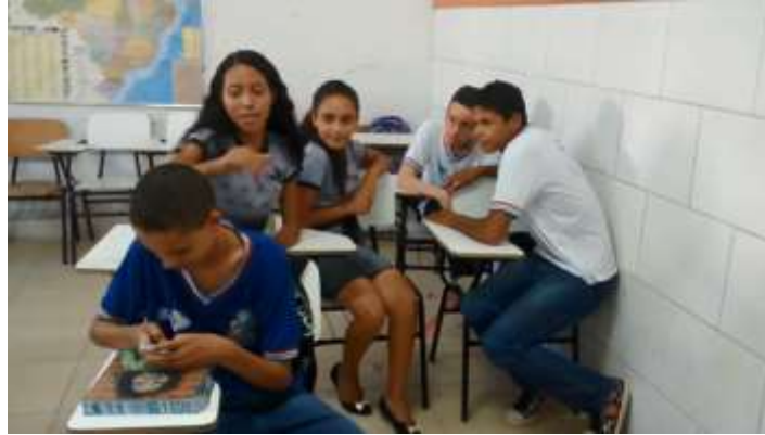
Figura 14 –Cena do curta-metragem.

celular que não dá atenção a ela, após inúmeras tentativas, a aluna empurra o colega da carteira, mesmo assim ele não se para de usar o aparelho. Ao fundo três alunos estão conversando, interagindo e observando a cena.