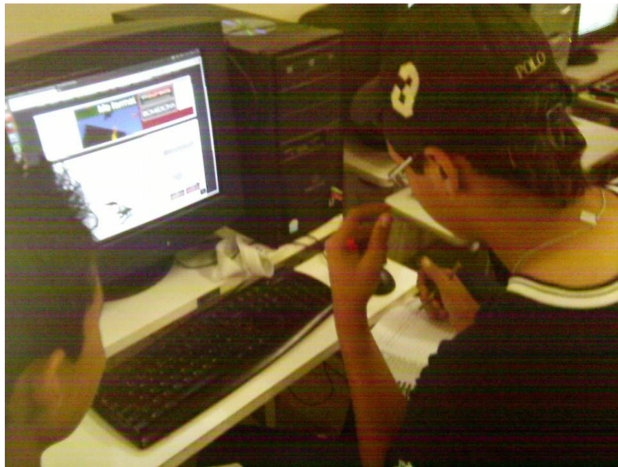
Foto 07: alunos em agrupamentos no laboratório de Informática produzindo conhecimento

quando da montagem do produto final – o documentário – observou-se que, desde o início, a questão do uso das tecnologias foi imprescindível na construção da aprendizagem dos investigados. No caso específico do uso do computador, através da edição do trabalho evidenciou que a inovação se faz presente de forma mais contumaz quando os alunos assumem uma certa autonomia na forma de elaborar o conhecimento, o aprendizado com o manuseio de instrumentos que possibilitam esta construção.