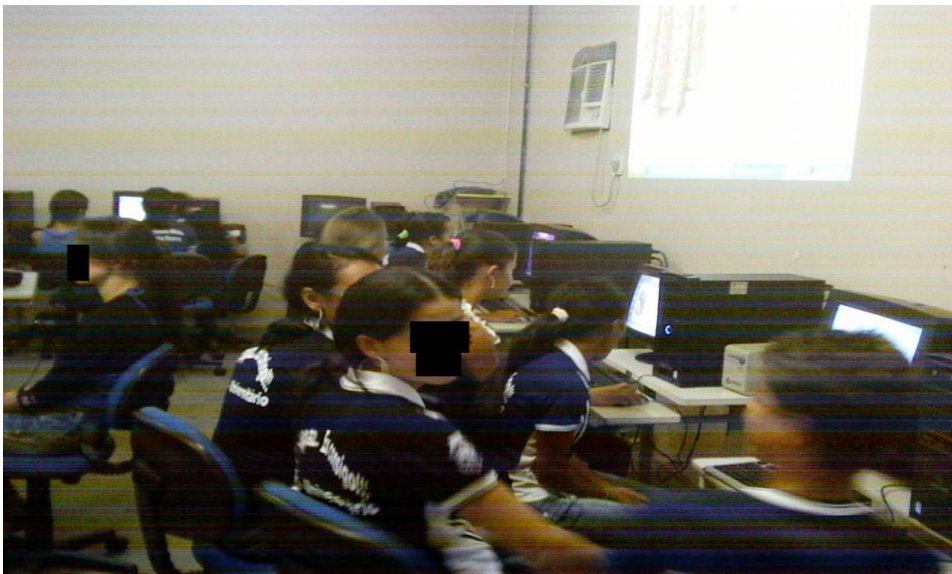
Foto 06: Aluno em atividade de edição documentário no Laboratório de Informática

Partindo das ideias de Fino (2007), quando argumenta sobre o papel da tecnologia como fator de inovação, considera “Como toda a gente compreenderá a inovação não reside na tecnologia propriamente dita, mas no que ela nos permite fazer com o seu auxílio”. (FINO, 2007, p. 39). Podemos inferir que o papel da tecnologia foi de extrema importância, visto que, permitiu aos alunos construir novos fazeres pedagógicos que só foram possíveis a partir do manuseio destas.