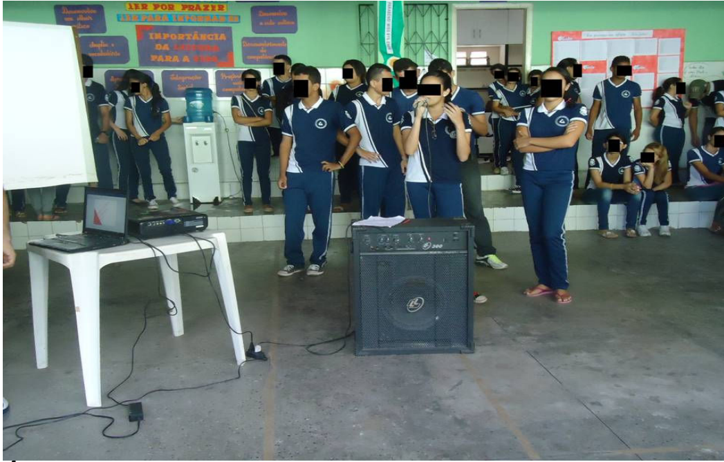
Foto 08: Alunos no pátio da Escola apresentando o documentário para a escola

Durante a apresentação do trabalho, os alunos permaneciam nervosos, apreensivos, porém, eufóricos e orgulhosos pelo término do trabalho. Foi um momento glorioso para toda a turma que implementou uma prática pedagógica desafiadora e extremamente gratificante no que concerne ao desenvolvimento de atitudes e habilidades até então adormecidas para alguns dos protagonistas.