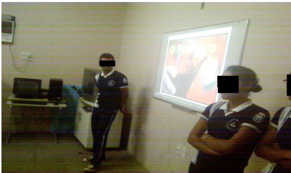
Foto 03: Grupo de alunos apresentando o documentário: resultado do trabalho

Durante esta atividade de visita ao LEI, o posicionamento pedagógico do professor evidencia o intuito de levar os alunos a articularem novas estratégias de produzir conhecimento. Percebia-se que os alunos permeavam tais descobertas com dúvidas, angústias, contudo, estes aparentavam confiantes e bastante entusiasmados.