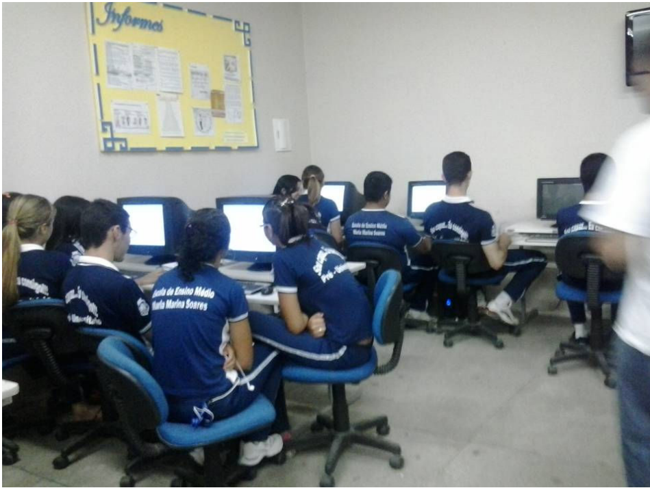
Foto 02: Alunos em atividade de pesquisa no Laboratório de Informática

Durante esta atividade de visita ao LEI, o posicionamento pedagógico do professor evidencia o intuito de levar os alunos a articularem novas estratégias de produzir conhecimento. Percebia-se que os alunos permeavam tais descobertas com dúvidas, angústias, contudo, estes aparentavam confiantes e bastante entusiasmados.