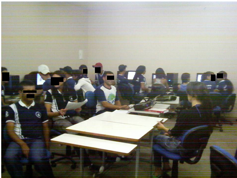
Foto 01: Professor e alunos em interação no desenvolvimento do trabalho, durante as decisões pedagógicas no laboratório de Informática

Compreenderam-se tais fatos em diferentes momentos durante o desenvolvimento dos trabalhos em sala de aula, o envolvimento e a mobilização que o professor consegue dos alunos quando da realização das atividades é relevante, pois ele os mobiliza para que haja envolvimento de todos de forma espontânea e criativa.