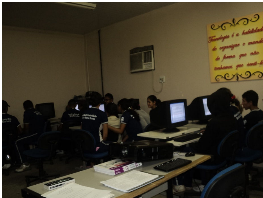
Foto 04: Alunos em equipe fazendo pesquisas no Laboratório de Informática

É importante salientar que, durante todo o trabalho de pesquisa de campo, houve o acompanhamento do investigador, que também presenciou o uso do LEI (Laboratório de Educação e Informática) da escola, iniciando com pesquisas até o término com a edição do documentário pelos membros do grupo, para dar um corpo final ao trabalho. Foi percebido que esta ferramenta – o computador – foi muito bem utilizada pelos alunos, alguns manuseavam com presteza, porém, outros necessitavam da ajuda do professor do LEI.