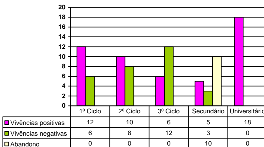
Figura 2 - Gráfico de frequência de vivências positiva e negativa mencionadas em cada nível de ensino

Ao nível do 1.º ciclo, 12 educadores referem ter tido vivência positiva e 6 educadores mencionam vivência negativa. Em relação ao 2.º ciclo vemos que 10 educadores referem vivência positiva e 8 referem vivência negativa. No 3.º ciclo, 6 educadores mencionam vivência positiva e 12 vivência negativa. No ensino secundário, é visível o abandono da disciplina de matemática por 10 educadores, 5 educadores relataram vivência positiva e 3 educadores referiu vivência negativa. No ensino universitário todos os educadores referem ter tido vivência positiva.