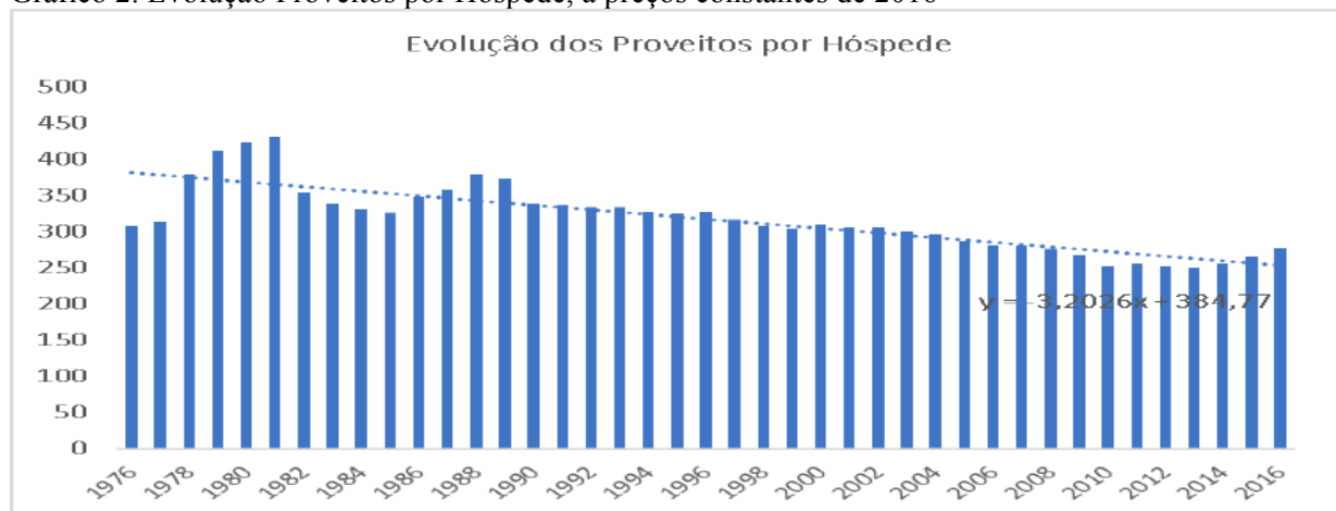
Gráfico 2. Evolução Proveitos por Hóspede, a preços constantes de 2016

A evolução errática da procura no período pós 2000, em contraponto com as expectativas de desenvolvimento sustentado do sector no período pós alargamento da infra-estrutura aeroportuária ocorrida em 2001, merece também a nossa atenção. O gráfico 3 sugere uma tendência crescente relativamente consistente, com quebras limitadas a um número reduzido de anos. A taxa média de crescimento anual ronda os 4,18% ao ano, no que se refere ao período 1976-2016. Contudo, o ritmo de crescimento desacelerou desde 1990, com uma perda de 0,05 pontos percentuais ao ano em termos de taxa de crescimento anual. Uma análise dos dados em termos de hóspedes, centrados no período 1976-2010, colocava o sector num estágio de estagnação, com riscos evidentes de declínio, caso não fossem tomadas medidas. O panorama afigura-se mais positivo caso se considere a recuperação encetada após 2012. Contudo, qualquer decisor no ativo nos anos de 2008-2012 não deixaria partilhar as preocupações relativas aos sinais de estagnação de evolução da procura e de subscrever a necessidade de encetar uma estratégia de recuperação da “dinâmica perdida” através da multiplicação de eventos, experiências e cartazes promocionais. Uma das áreas a merecer a atenção incidiu nos recursos culturais e patrimoniais da região, dado o seu patamar de desenvolvimento relativamente incipiente na altura.