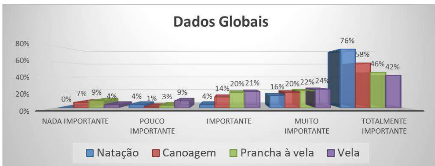
Gr fico 3 – Dados referentes ao terceiro e quarto ano, quanto   prefer ncia relativamente   pr tica de cada modalidade nas aulas de Educaç o F sica.

J  no que se refere   prefer ncia relativamente   pr tica de cada modalidade nas aulas de Educaç o F sica (Gr fico 4), tendo em consideraç o a escala apresentada, verificamos que das 3 mais votadas (futebol, nataç o e canoagem), duas s o atividades n uticas.