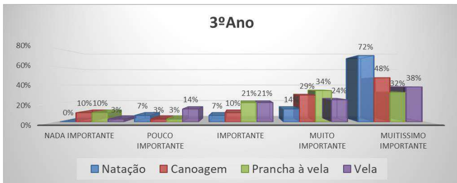
Gráfico 1 – Dados referentes ao terceiro ano, quanto à preferência relativamente à prática de cada modalidade nas aulas de Educação Física.

Quanto ao 4º ano (Gráfico 2), os resultados obtidos foram muito semelhantes, sendo que a grande maioria dos alunos também considerou muitíssimo importante a realização da natação com 78%, canoagem com 66%, prancha à vela com 58% e vela com 45%. Os valores são um pouco mais elevados o que se pode dever ao facto de já terem tido um maior número de vivências nestas atividades.