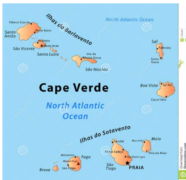
Mapa 1: Cabo Verde Fonte: Internet. [consult. 2013-4-4]

Vista, Sal, São Nicolau, São Vicente e Santo Antão), mais influenciados pelo Português, pelo que julgo sempre ser oportuno, ao longo do presente trabalho, recordar ao leitor que: