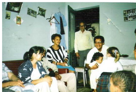
Figura 4: O autor, à direita, rodeado de familiares e amigos, dialogando em Crioulo. e em português, em Cabo Verde (Achada de Santo António – Praia Santiago), em 1988, durante uma das etapas de recolha de material para este trabalho.