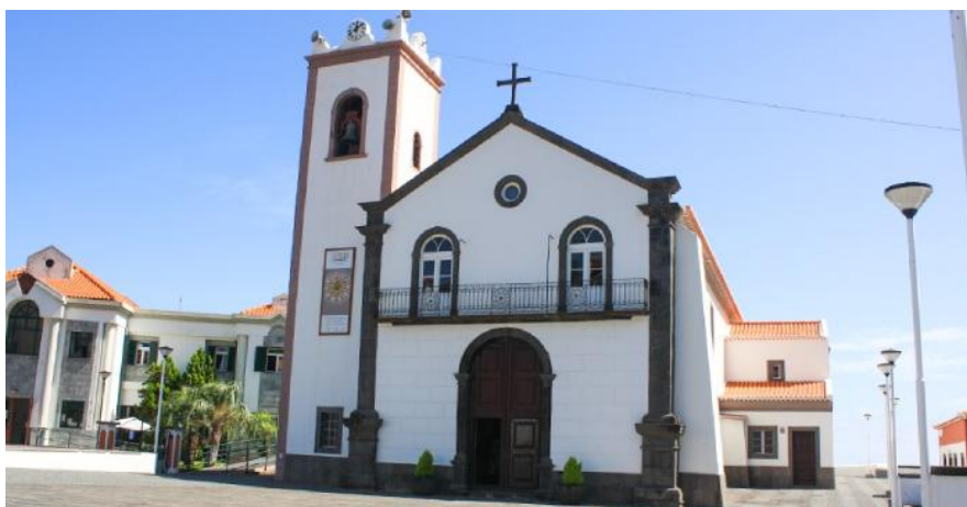
Figura 9 - Igreja do Senhor do Bom Jesus

Ao chegar à Igreja do Bom Jesus, os visitantes são recebidos por uma fachada simples, mas elegante, típica das igrejas madeirenses. O interior, de estilo neo-manuelino, é decorado com altares dourados e uma sacristia barroca. As belas pinturas no teto e o crucifixo queimado, sobrevivente de um incêndio em 1908, são testemunhos da rica história e devoção que permeiam este local. Para além disso, a igreja é o centro de um dos maiores arraiais da Madeira, atraindo anualmente muitos peregrinos de toda a ilha.