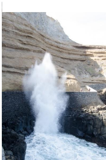
Figura 8 - Furna do Negro

Para descobrir a próxima lenda, o participante deve seguir até à piscina municipal e caminhar pelo passeio marítimo do Porto da Cruz. Ao longo deste caminho, poderá apreciar o mar bravio e as formações rochosas. Após cerca de quatro minutos de caminhada, encontrará impressionantes formações rochosas de origem vulcânica emergindo do mar. Estas rochas formam grutas marítimas naturais, onde as ondas do Atlântico batem violentamente, criando um espetáculo fascinante de espuma branca e salpicos. É neste local que se desenrola a lenda da Furna do Negro.