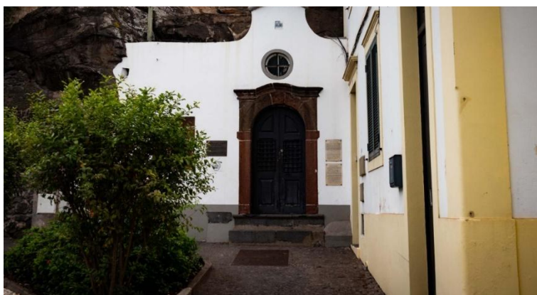
Figura 4 - Capela das Almas Pobres

Com a tocante história desta capela em mente, convidamo-lo a iniciar a sua jornada pela Madeira, mergulhando nas ricas lendas e histórias que moldaram esta encantadora ilha. Através destas lendas, é possível vislumbrar o quotidiano das pessoas, as suas histórias, cultura e tradições, transmitidas de geração em geração. Embora quem a visita hoje não precise temer atentados, a história desta pequena capela permanece viva, oferecendo uma ligação tangível ao passado e um testemunho da fé da comunidade local.