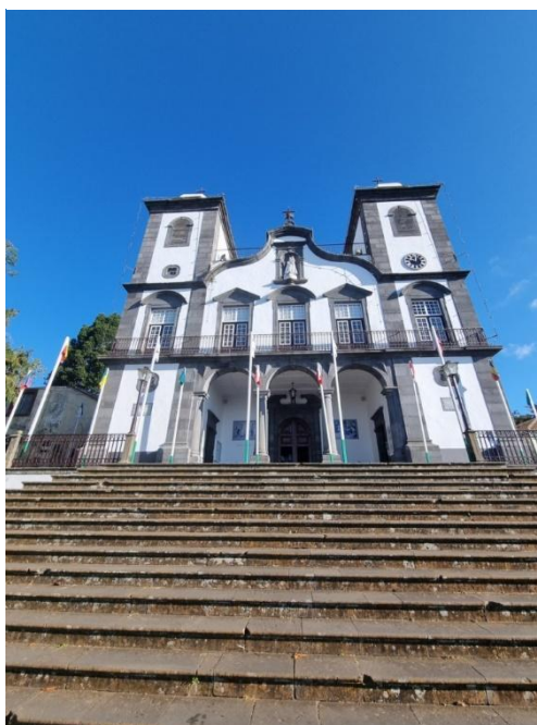
Figura 5 - Igreja da Nossa Senhora do Monte

Esta lenda, transcrita a seguir, é a da aparição de Nossa Senhora do Monte a uma simples pastora no Terreiro da Luta.