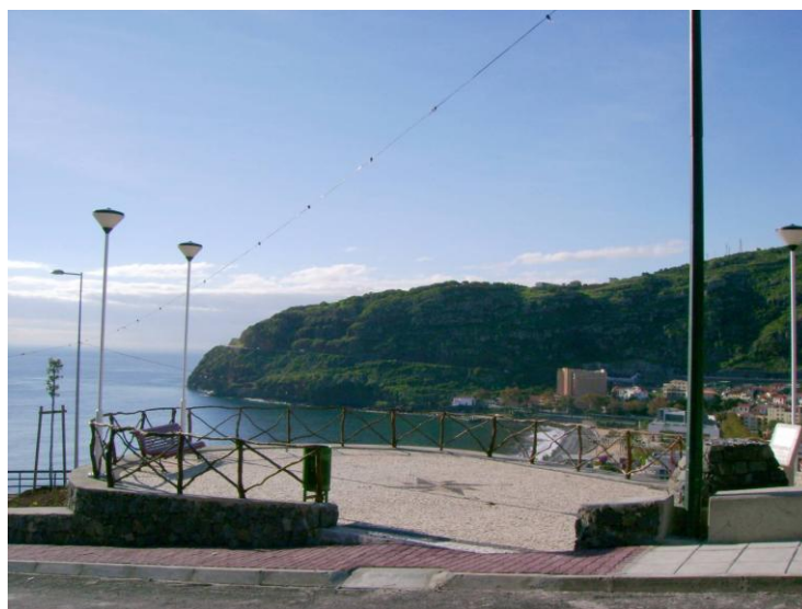
Figura 6 - Miradouro do Senhor dos Milagres

Para compreender melhor esta lenda, faz sentido apreciar a vista de um dos vários miradouros de Machico. Recomendamos especialmente o Miradouro do Senhor dos Milagres, por ser mais central e próximo da cidade. Este miradouro oferece uma vista panorâmica espetacular da baía e da cidade de Machico, proporcionando o cenário perfeito para conhecer esta lenda, podendo ser um local ideal para descansar e tirar fotografias.