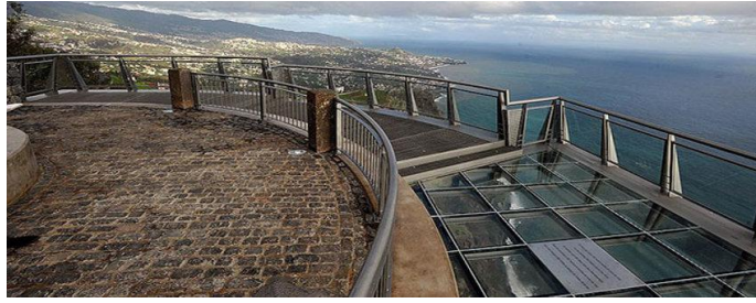
Figura 11 - Miradouro do Cabo Girão