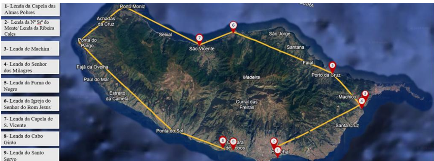
Figura 13 - Itinerário do roteiro