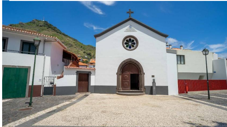
Figura 7 - Capela do Senhor dos Milagres