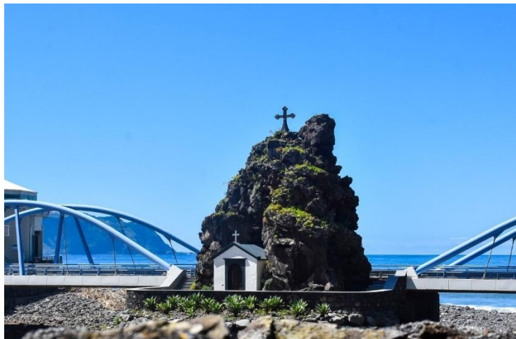
Figura 10 - Capela de S. Vicente

pequena e encantadora capela incrustada num bloco de rocha basáltica na foz da ribeira. Esta pequena capela foi erguida em 1694, e a sua origem vem da seguinte lenda: