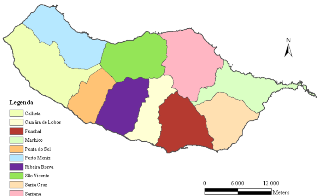
Figura 2 - Concelhos da Ilha da Madeira

de Lobos, Ribeira Brava, Ponta de Sol, Calheta, Porto Moniz, São Vicente, Santana, Machico, Santa Cruz (ver figura 2) e por cinquenta e quatro freguesias.