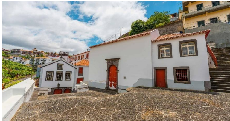
Figura 12 - Convento de São Bernardino