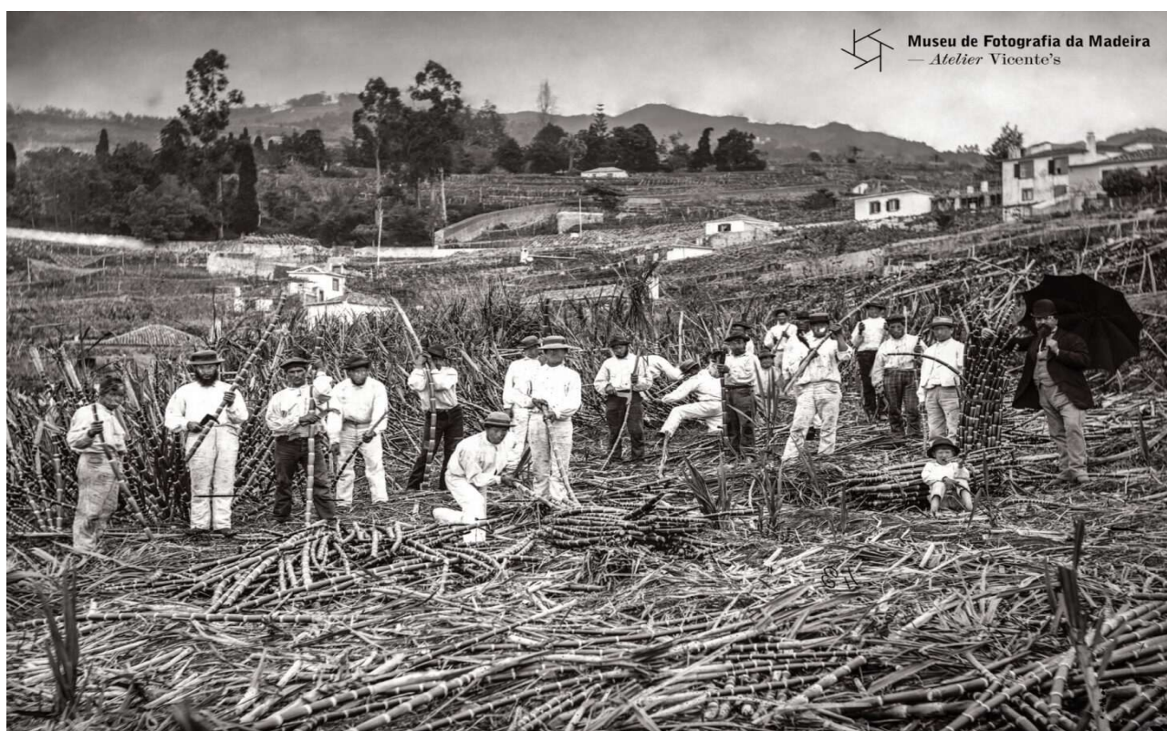
Fig. 1 - Fotografia de data desconhecida - Museu de Fotografia da Madeira Atelier Vicente's

Da cana-de-açúcar ao “Rum da Madeira” Efeitos sociais, culturais, económicos e fiscais na Ilha da Madeira