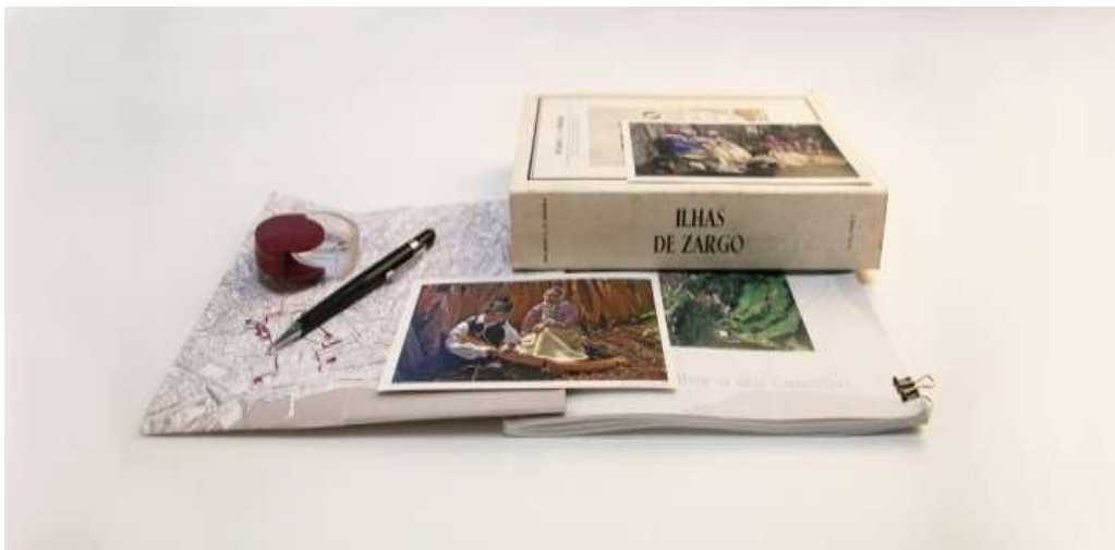
Fotografia do curso no sítio da UMA na internet

Dissertação apresentada à Universidade da Madeira para obtenção do Grau de Mestre em Estudos Regionais e Locais