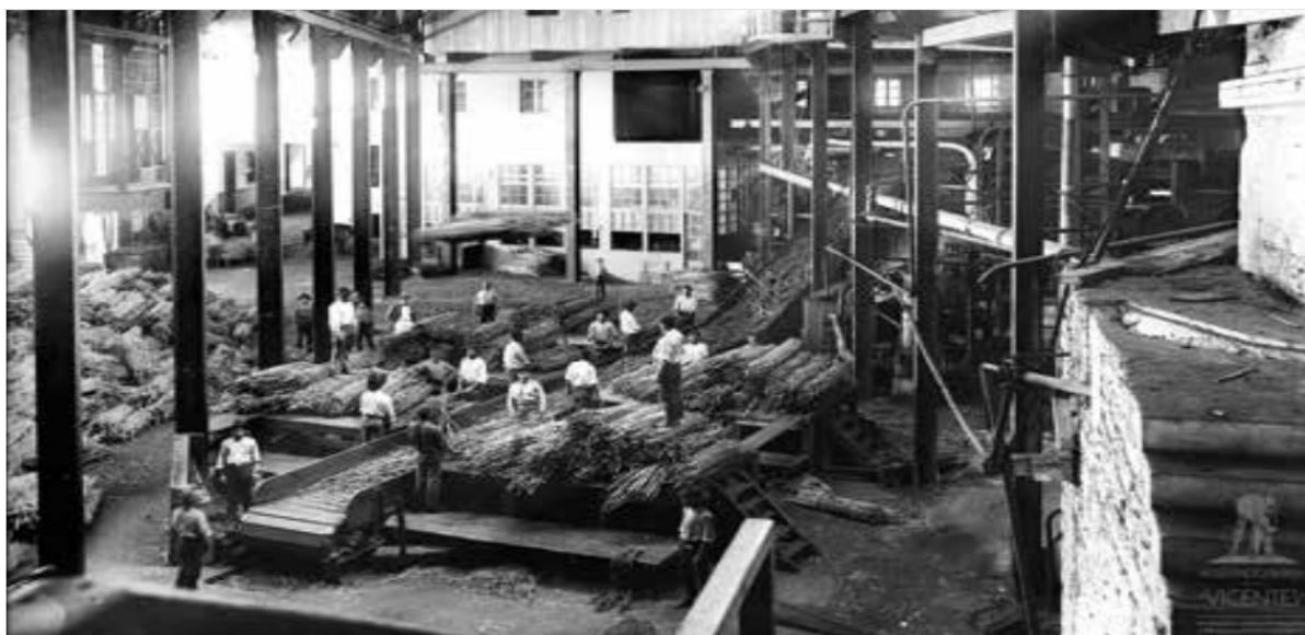
Figura 4 - Interior da Fábrica do Torreão, Freguesia de Santa Luzia – Funchal, s.d. Perestrellos Photographos, negativo em vidro, ABM, PER, n.º inv. 511.

A família Hinton possuía considerável fortuna na ilha da Madeira. O britânico William Hinton viajou para a Madeira em busca de tratamento para os seus problemas de saúde. Dessa forma, ele construiu a sua fortuna através das indústrias de vime, da banana e açúcar onde se destacou como o maior produtor, mantendo um monopólio que persistiu por vários anos.