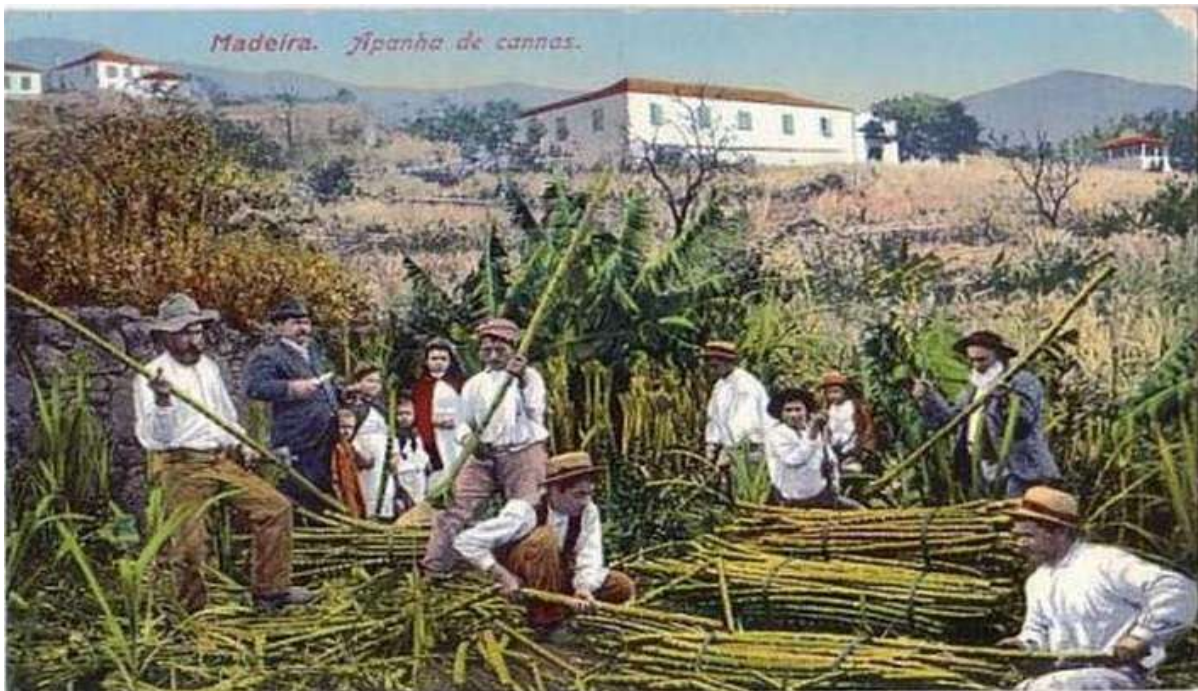
Figura 2 - Fotografia de data desconhecida motor de busca Google

[...] apanham primeiramente as canas e estendem-nas por ordem nos sulcos. Depois, cobertas de terra, vão-nas regando amiudadas vezes, de modo que a terra sobre os sulcos não se torne seca, mas se mantenha sempre húmida. Daí que, pela força do sol, cada nó produz a sua cana que cresce a pouco e pouco cerca de quatro braças. (...). Assim amadurecem ao fim de dois anos e, quando maduras, cortam-nas na Primavera, rente ao pé. Os pés, germinando de novo, produzem outras canas para o ano seguinte, as quais não crescem tão altas, mas com cerca de menos uma braça e, ao fim de um ano, ficam maduras. Cortadas estas segundas, arrancam totalmente as plantas para depois, no devido tempo, reporem outras canas como se disse.