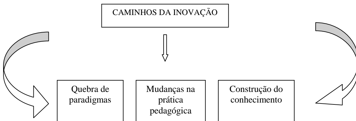
Figura 1 – Caminhos da inovação

indivíduos possam “aprender de que maneira aprender e de que forma autorregular a própria aprendizagem para enfrentar os desafios de um contexto tão aberto, cambiante e incerto” (PÉREZ GÓMEZ, 2011, p. 68).