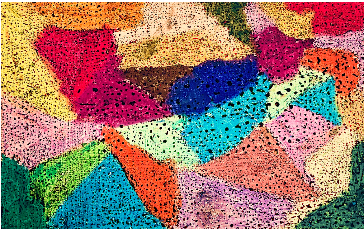
Imagem 1 – desenho realizado a pastel de óleo sobre papel preto, por uma criança que frequenta o Atelier Gatafunhos