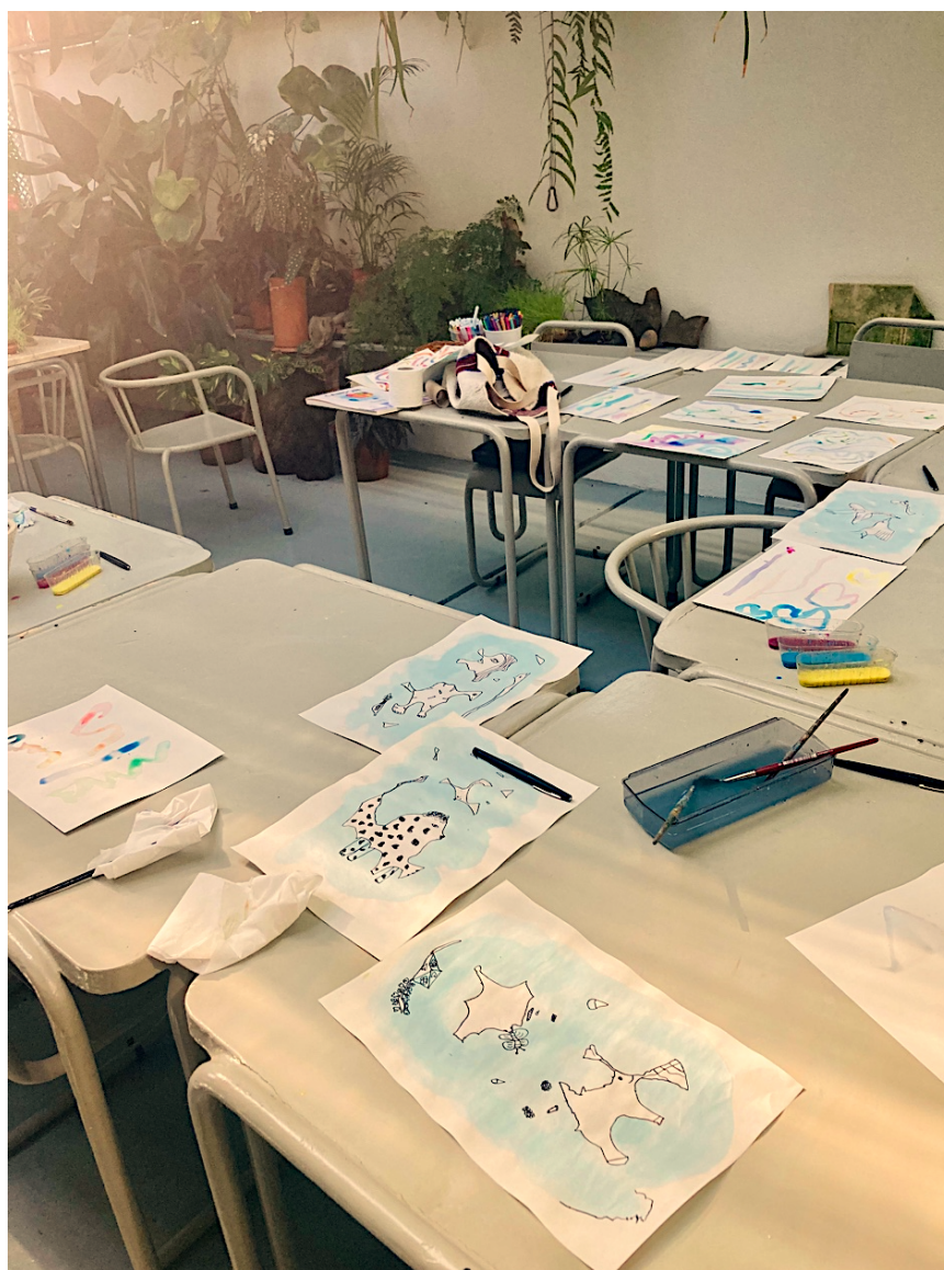
Imagem 2 – fotografia da sessão “Cabeça nas Nuvens”