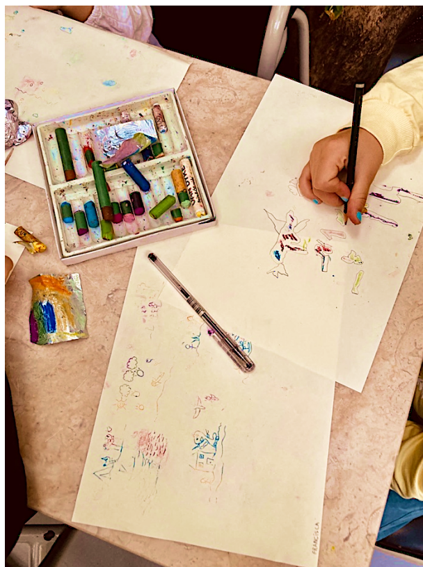
Imagem 3 – Crianças a desenharem a pastel de óleo

Um dos pontos a referir é o de que as crianças acabaram por formar os seus grupos, dentro do grupo principal do atelier, como podemos verificar na imagem 3, onde a artista divide os materiais desta forma. Escolhem os colegas que têm mais afinidade para essa partilha, mas nunca desprezam os outros grupos, visto que mesmo estando em grupos falam uns com os outros. Apesar de estarem muito unidos, visto não existir muito espaço, não copiam os colegas, não olham para o lado, não dizem mal e aceitam as diferenças uns dos outros que até chegam a elogiar os trabalhos dos colegas, dizendo até “Uau, está bonito!”, assim como “as identidades pessoais podem ser vistas como as histórias que construímos e contamos acerca de nós e que definem quem somos para nós e para os outros.” (Lima, 2018, p. 19).