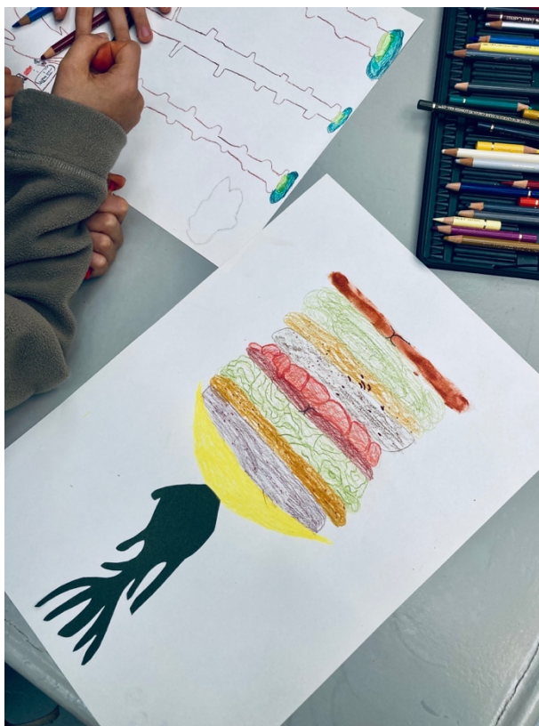
Imagem 9 – desenho de um menino, onde retrata um hambúrguer a nascer da sua raiz

que não devem pensar só neles, sendo que isto só ajuda no seu crescimento pessoal e afirmação das suas identidades.