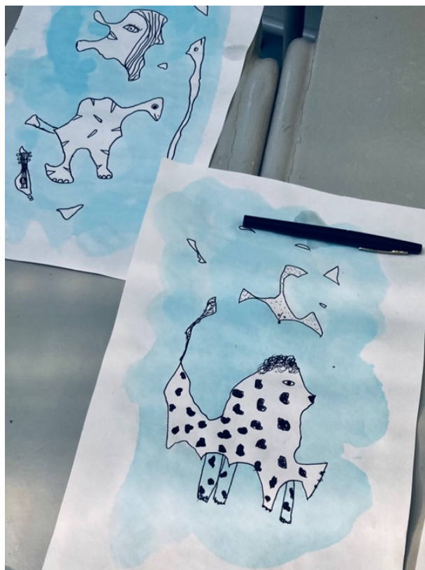
Imagem 5 – desenhos efetuados na primeira sessão de observação, a aguarela e marcador

presentes em toda a experiência estética e têm raízes e finalidades antropológicas, pois falamos de nós mesmos” (Ferreira, 2016, p. 112).