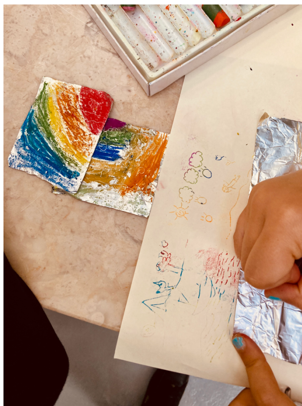
Imagem 11 – exercício prático

Visto estarem a fazer misturas de cores, linhas e diferentes formas, a Luísa aproveita este momento para ensinar a diferença entre: linhas, formas e texturas, dando sempre exemplos práticos dos mesmos, como podemos conferir na imagem 12.