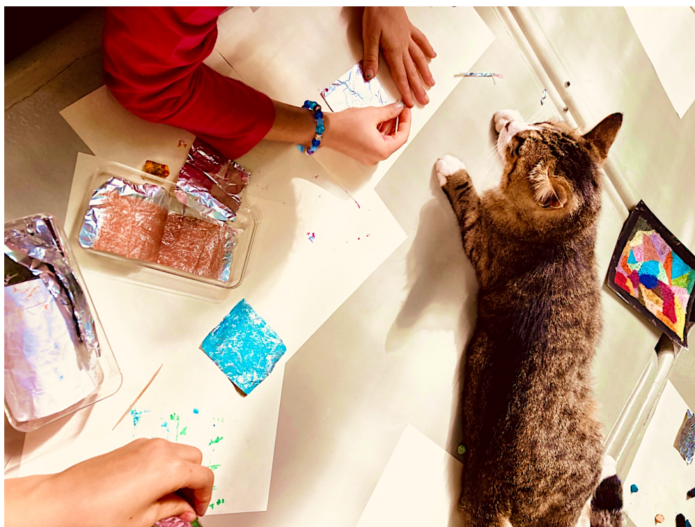
Imagem 4 – as crianças do atelier, com o gato residente da PORTA33