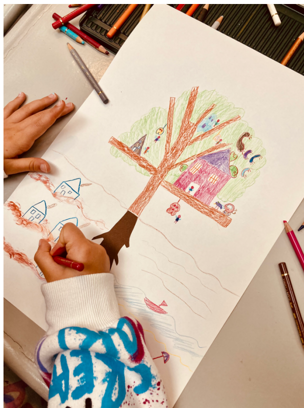
Imagem 8 – menina a construir um desenho a partir da sua raiz

estariam a fazer daqui a 10 anos e falam do futuro ou da possível ida para a universidade, sendo que falam de possíveis profissões. Quem nunca pensou no que queria ser quando crescesse? Faz parte do nosso crescimento e é engraçado pensarmos que já quisemos ser tanta coisa e mais alguma.