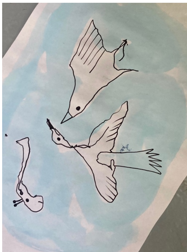
Imagem 6 – desenho efetuado na primeira sessão de observação, a aguarela e marcador

A última atividade desta sessão, consistiu num desenho coletivo, fazendo uso do lápis, onde cada um desenhou um pouco e o desenho foi passando por todos. Este exercício teve a duração de aproximadamente 10 minutos. Neste desenho desenharam o que conhecem, de memória e de forma rápida, porque têm apenas uns minutos para passarem para o desenho seguinte. Como podemos comprovar na imagem 7, cada um desenhou o que quis, para preencher e enriquecer o trabalho do outro.