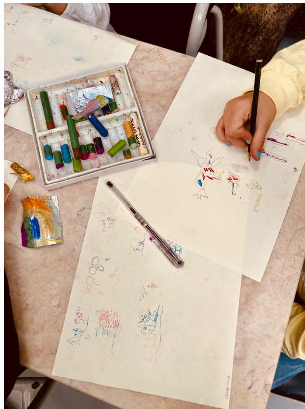
Imagem 10 – desenho a pastel de óleo