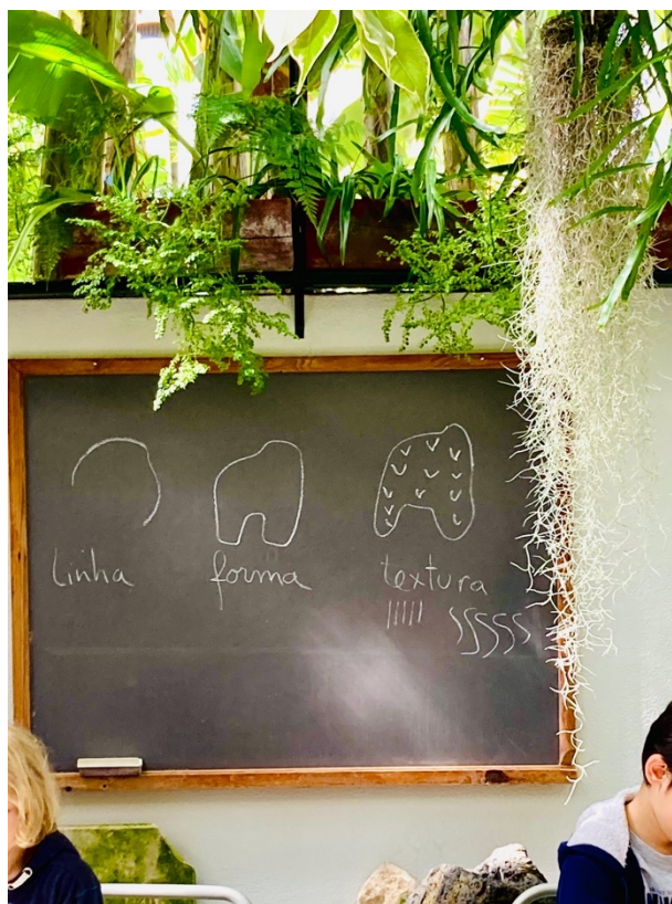
Imagem 12 – fotografia do quadro

Após o término deste exercício, ficaram com meia hora, que foi aproveitada para um outro exercício coletivo. Este consistiu no desenho numa cartolina preta, com lápis de cor, onde cada um contou uma história, antes de desenharem e todos tiveram que desenhar a história – Dando como exemplo: “Era uma vez uma folha ...” e um disse “... que da folha nasceu uma planta”.