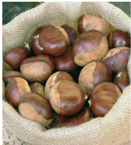
Fig. 2 - Aspecto da castanha regional.

Em Portugal continental, a tradição do consumo também se situa, sobretudo, entre os Santos e o São Martinho, mas é igualmente forte na quadra do Natal. O mercado da castanha congelada pode ir de Janeiro até Maio, abastecendo, maioritariamente, agro-indústrias europeias de transformação de castanha, designadamente de confeitaria e doçaria, constituindo para os agricultores uma boa opção para o escoamento da totalidade das produções.