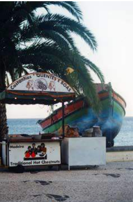
Fig. 1 - Barraquinha de venda de castanha.