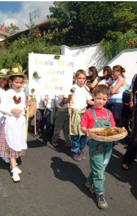
Fig. 3 - Aspecto da Festa da Castanha no Curral das Freiras.

Se bem que as variedades regionais de castanha na Madeira sejam reconhecidas pelos consumidores como tendo em geral uma boa qualidade, designadamente a nível organoléptico (Fig. 3), não existe ainda um estudo completo que as avalie e caracterize quanto a outros parâmetros de natureza comercial e tecnológica.