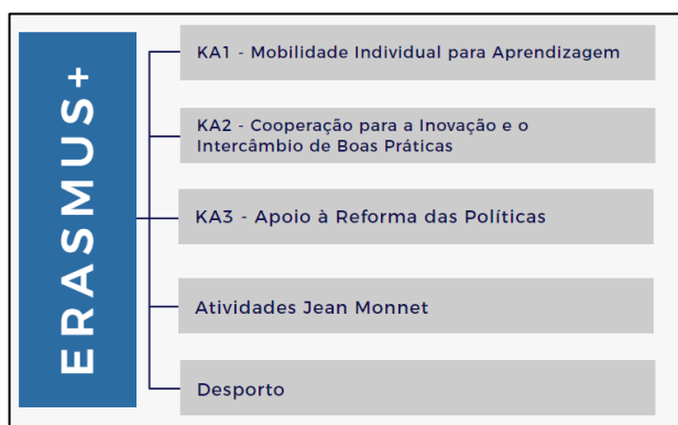
Esquema 1 – Ações e atividades integrantes do Programa Erasmus +

A nossa abordagem ao Programa Erasmus + Educação e Formação incide no Ensino Escolar que conta, cada vez mais, com instituições que incluem objetivos de internacionalização nos seus projetos educativos, com atividades de cariz intercultural e de inovação estrutural para aumentar a qualidade do ensino e aprendizagem (Erasmus+, 2019b). Atualmente o Programa estrutura-se em ações-chave e engloba organizações ativas em qualquer domínio da educação (formal e não formal), formação ou juventude, bem como organizações que realizam atividades transversais. As mesmas estão representadas no Esquema 1.