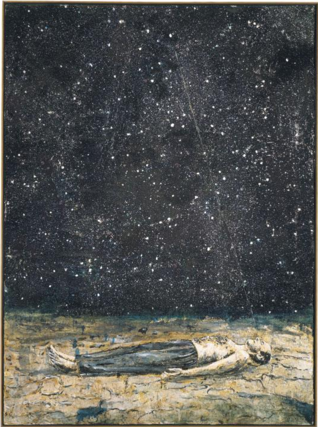
Figura 2 – Sternenfall (Kiefer, 1995)