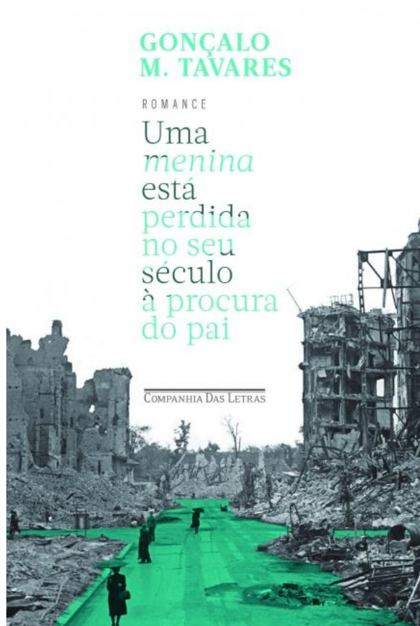
Figura 4 – Uma Menina Está Perdida no Seu Século à procura do Pai (2015)