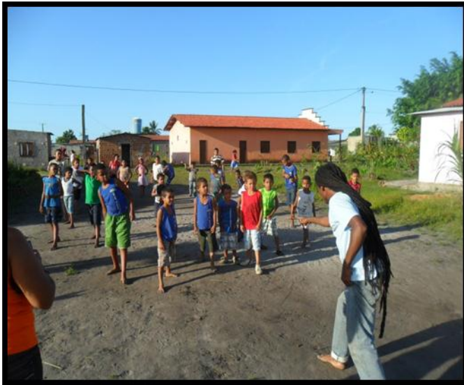
Figura 38:- Aula pública ministrada por morador.

“Você precisa saber O que passa aqui dentro Eu vou falar pra você Você vai entender A força de um pensamento Pra nunca mais esquecer”.