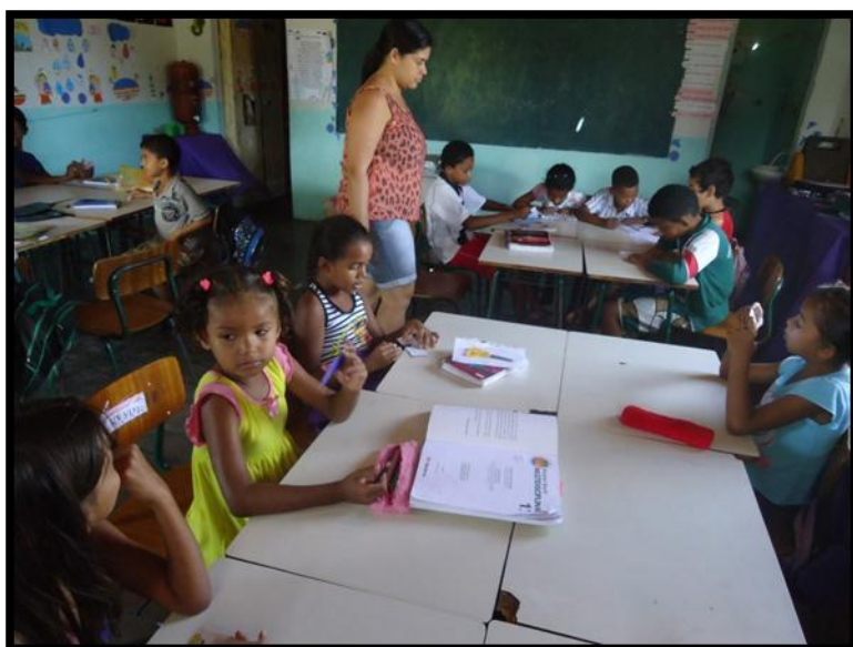
Figura 2: A prática na sala

“A plataforma dessa estação É a vida desse meu lugar É a vida.” ( Encontros e Despedidas de Milton Nascimento).