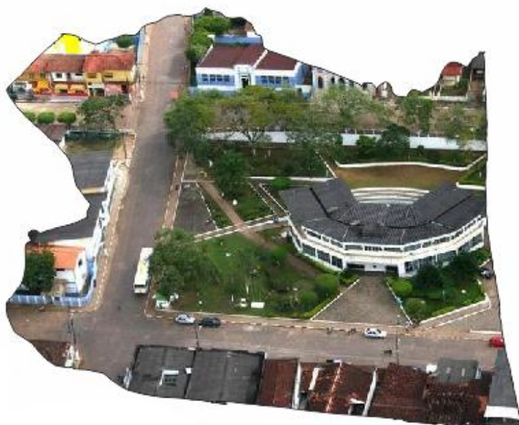
Figura 5: Esboço do mapa da cidade: Vista aérea de Una

“Nobres filhos da raça dos fortes, Povo unense a fazer grande historia,” ( Hino de Una-Letra do Pe. Paulo Azevedo)