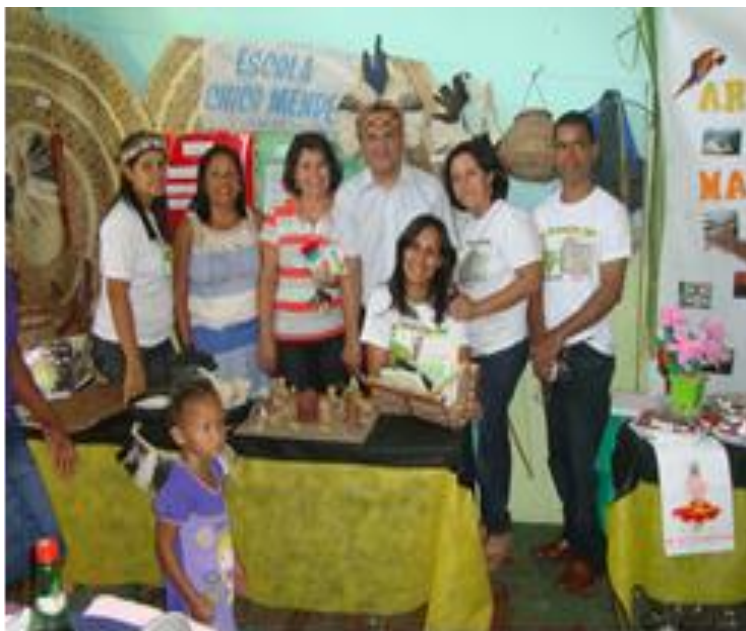
Figura 41: I Mostra cultural das escolas.

“Chega de tentar dissimular e disfarçar e esconder