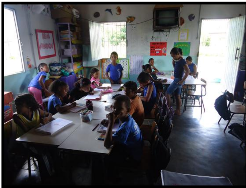
Figura 7: Organização da turma

Por outro lado, o espaço físico é um casebre com apenas uma sala, uma pequena cozinha e um banheiro. Sua estrutura arquitetônica não lembra uma escola como a conhecemos, lembra uma residência. Há energia elétrica, a água encanada, no entanto, é um espaço muito quente, apertado, precisando ser ampliado, visto que a organização da sala está sob a forma de pequenos grupos conforme imagem abaixo: