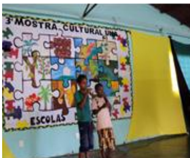
Figura 42: Três anos de mostra de arte das escolas do campo

Em outras palavras, esse 1º movimento de mobilização de saberes demonstrando toda a diversidade que existe dentro da unidade que é o município contou com a apreciação de 678 visitantes da sociedade civil além de representação do poder executivo, clero, legislativo, e outras entidades. Para materializar a proposta, houve uma caminhada de escuta, conflito de ideias entre os professores equipe gestora, coordenadora e supervisores das escolas, onde se discutiu o que os alunos e as pessoas do campo sabem sobre seu município e, o que precisavam saber-aprender sobre ele.