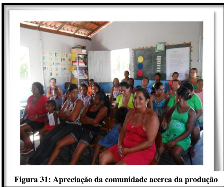
Figura 31: Apreciação da comunidade acerca da produção

Paródia em ritmo da melodia: Colorir papel do cantor baiano Jamil.