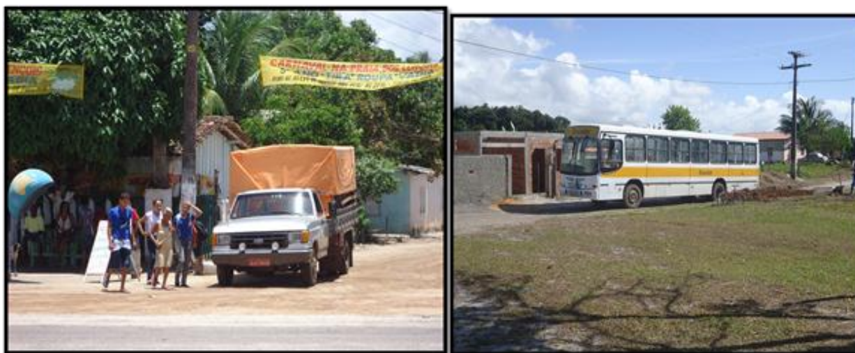
Figura 20: O transporte escolar

Até os tempos atuais esse modelo ainda se faz presente em muitos espaços do campo em Una, nota-se também que a merenda escolar e os recursos didáticos chegam a demorar meses, atrelam-se os atrasos as péssimas estradas rurais e a falta de transporte municipal. No entanto, os problemas citados não são de responsabilidade de quem está no campo e estes, não podem ter seus direitos lesados, entretanto, as relações de poder legitima o controle social e consegue manter seus ecos abafados. Por isso, esta forma biopolítica do controle do corpo (Foucault 1984, p. 80), não é exclusividade de um grupo ou de uma classe, mas, é uma rede de poder que se estabeleceram nas práticas, sociais, pois, sabemos que desde nosso crescimento somos submetidos a relações de poder, no seio familiar, na escola, na igreja, no trabalho e, à medida que essas relações se apropriam de nossas vidas, o nosso corpo reage ora tirando proveitos, se beneficiando, ora lutando, confrutando ideias, mobilizando saberes.