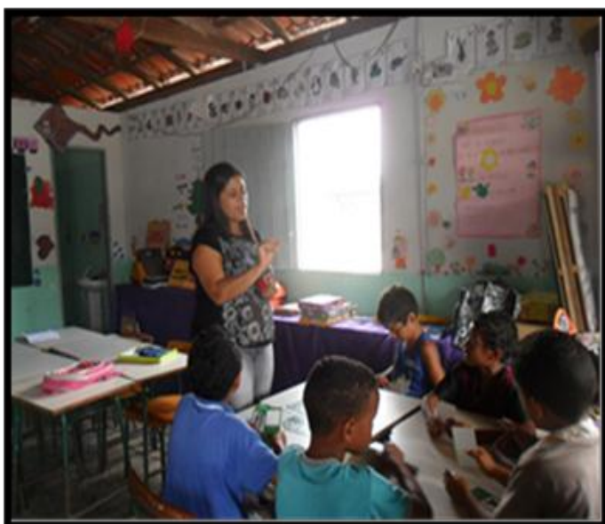
Figura 33: Trabalhando com os diferentes grupos na sala multisseriada

“E há que se cuidar do broto; Pra que a vida nos dê Flor e fruto.”