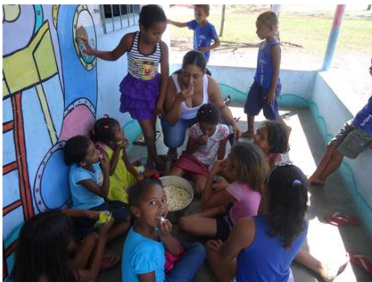
Figura 1: Dividindo a merenda

“Tudo que se vê, não é, de novo, do jeito que vi a um segundo, Tudo muda o tempo todo, no mundo.” (Como uma onda de Lulu Santos e Nelson Mota)