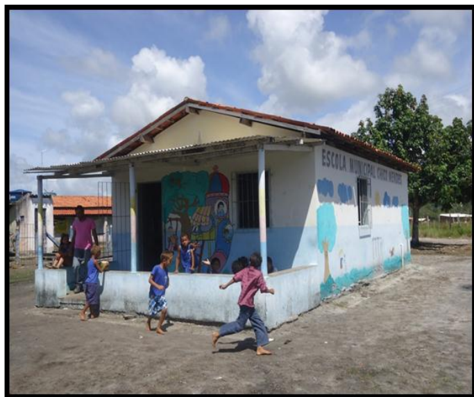
Figura 6: Fachada da escola

A escola Chico Mendes está localizada na região dos Lençóis em Una-Bahia-Brasil, uma comunidade litorânea com cerca de 150 famílias que sobrevivem do pequeno comércio informal local, da lavoura, e do trabalho assalariado. O povoado tem uma AAPML- Associação dos Agricultores, Pescadores e Moradores do Lençóis e Região cujo CNPJ é: