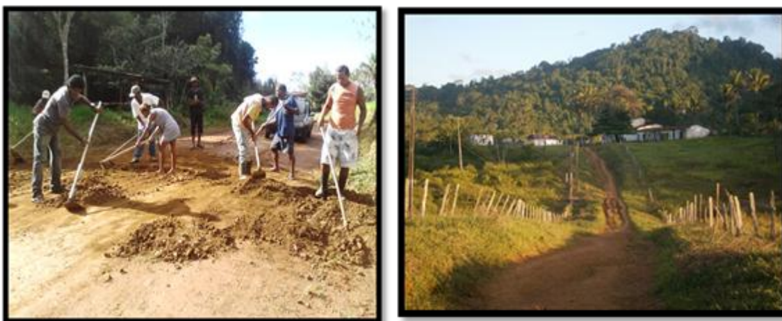
Figura 21: Condições das estradas da zona rural de Una

Além de se pensar no atendimento a educação infantil, faz-se necessário se pensar em melhoria das condições das estradas rurais; Conforme dizia Apple (1989, p. 91): “a cultura do trabalho não é facilmente visível ao observador externo e, como nos estudos do currículo oculto, é preciso viver dentro dela para chegar perto de uma compreensão de suas sutilezas e organização”;