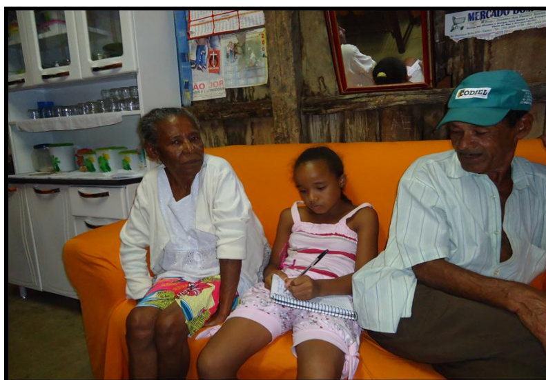
Figura 40: Uma valerosa atividade extraclasse