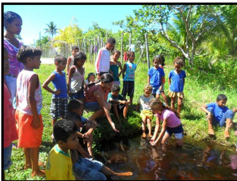
Figura 26: Transformação da rotina da escola

Como nasce a inovação? Como se percebe que uma ação, um instrumento pode provocar mudanças qualitativas para a vida da pessoa? Inovar é o mesmo que inventar? Como materializar uma prática pedagógica inovadora no espaço escolar? Como imaginar uma escola pós-moderna diferente do que temos hoje, que faça uso dos avanços tecnológicos, não para a instrução, mas para o máximo de aprendizagem? Como inovar sem reproduzir práticas instrucionistas? Essas e outras perguntas me vêm à mente, ao explorar minuciosamente a trajetória da escola, sempre alicerçada num modo de ensino que tem como foco, o conhecimento apreendido pela transmissão.