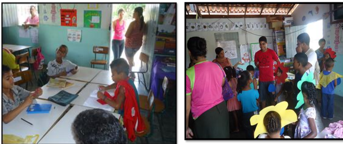
Figura 10 Aproximação natural das pessoas da comunidade a vida da escola

passa dentro da sala de aula. Além disso, os mesmos convidam a professora para participar dos festejos familiares e também são convidados para desenvolver oficinas de saberes na escola.