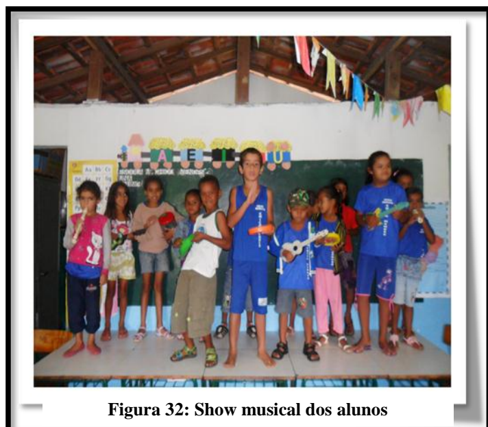
Figura 32: Show musical dos alunos

Conhecer a beleza do lugar A escola é um pouco pequena Raio brilho é esta beleza Planta o pé no chão O povo unido com ela Traz a esperança bela Com muita emoção Vamos visitar a escola Chico Mendes Uma escola que promove educação Venham todos juntos Passear pelos lençóis Conhecer a beleza do lugar E a alegria Sempre esta a acontecer Pois a educação É que transforma meu viver