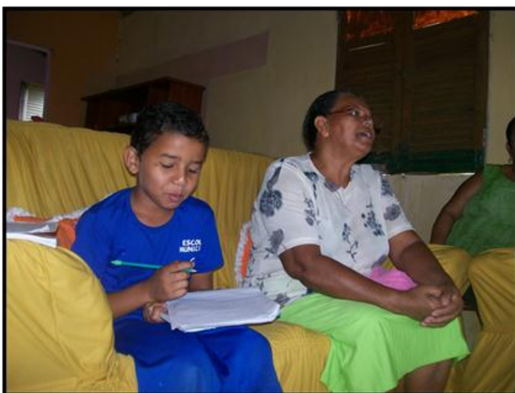
Figura 25: Os relatos de vida

“Memória de um tempo onde lutar Por seu direito É um defeito que mata São tantas lutas inglórias São histórias que a história Qualquer dia contará”. ( Pequena memória para um tempo sem memória de Gonzaguinha).