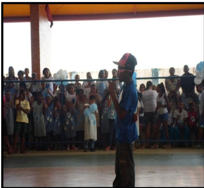
Figura 27: A prática educativa nos diversos contextos

Por muito tempo, as palavras: prática educativa e inovação pedagógica soaram como exclusividade da cultura da escola. Poucos serão aqueles que associarão prática educativa a um fenômeno que acontece onde estiverem pessoas, e que envolve sempre um