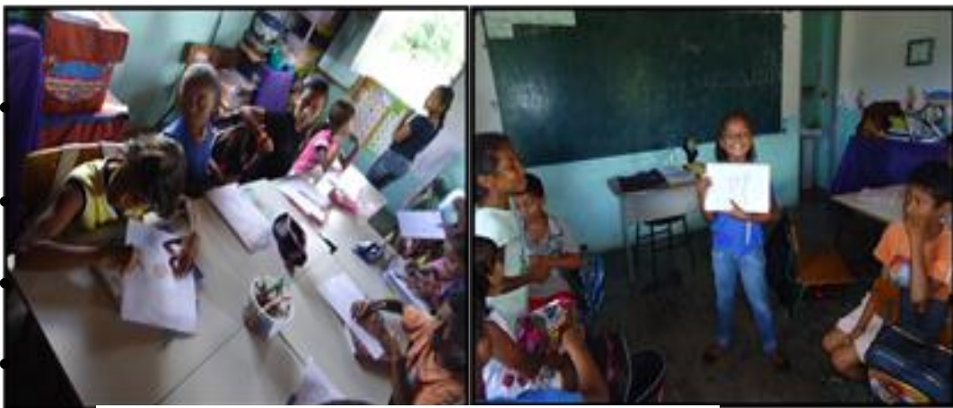
Figura 35: Atividade diversificada