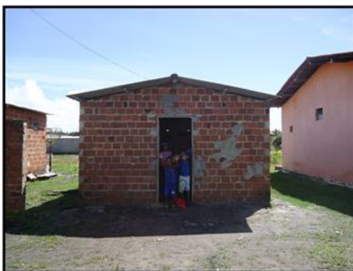
Figura 15: Anexo da escola Chico Mendes

Por outro lado, o número de alunos desta escola começou a se elevar, sobretudo, a partir de 2010, chegando nesse período a um total de 45 alunos. Desse modo, inicia-se a solicitação