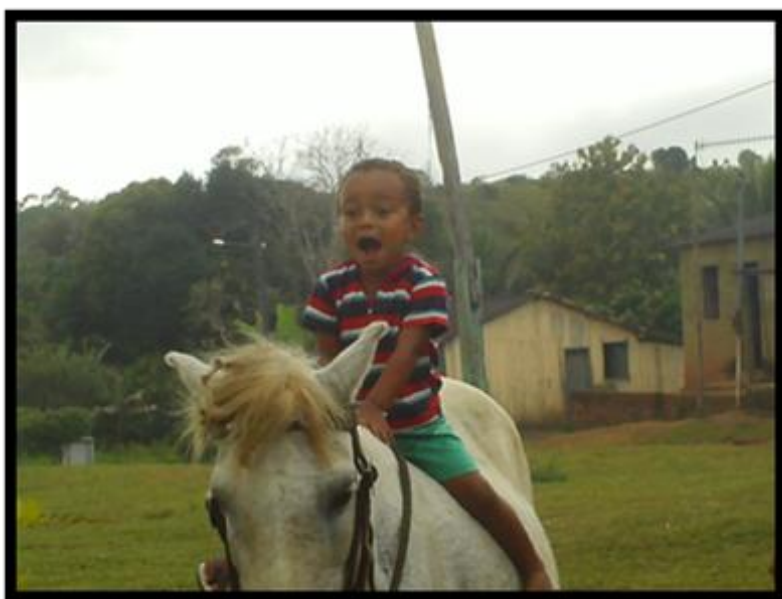
Figura 16: Aprendizagem

eeeeh! Oh! Oh! Vida de gado Povo marcado, Êh! Povo feliz!... ( Admirável gado novo: Alceu Valença e Zé Ramalho).