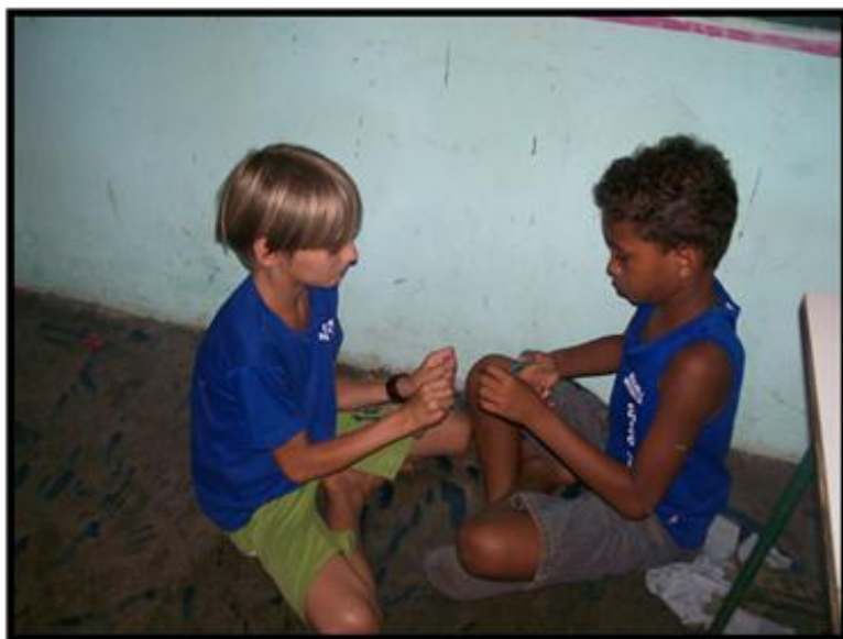
Figura: 11- Criação de brincadeira

“Eu quero ficar perto De tudo que acho certo Até o dia em que eu Mudar de opinião”. (Coisas que eu sei de Dudu Falcão)