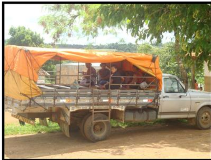
Figura 22: Transporte escolar dos locais de difícil acesso

transportes de péssimas condições ou inapropriado para a locomoção de pessoas. Por esse motivo, mais uma vez, a questão das péssimas estradas gera um alto índice de irregularidades na assiduidade dos alunos do campo a escola;