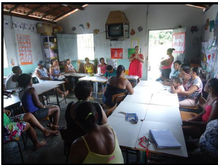
Figura 12 reunião de pais na escola

da aprendizagem dos alunos. Durante a reunião, ela destaca a realização dos eventos 9 que pretende desenvolver na escola e solicita a participação ativa deles.