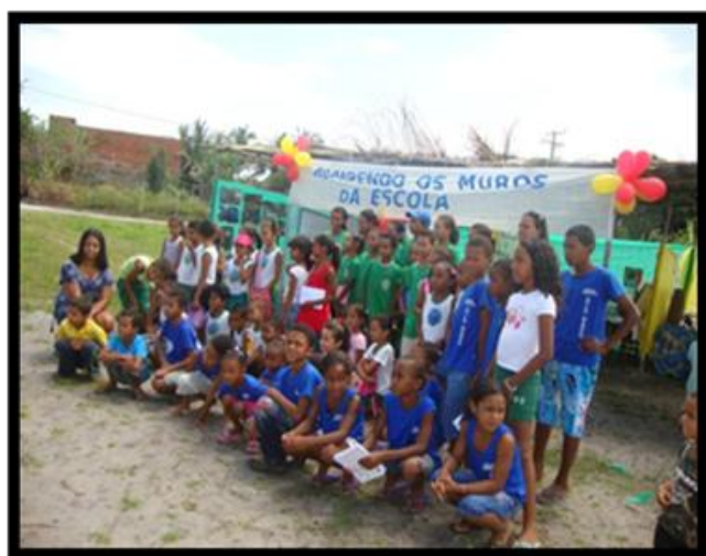
Firura: 23- Culminância do projeto Rompendo os muros da escola

Eu tô aqui pra que? Será que é para aprender? Ou será que é pra sentar, me acomodar e obedecer? (Estudo errado de Gabriel Pensador)