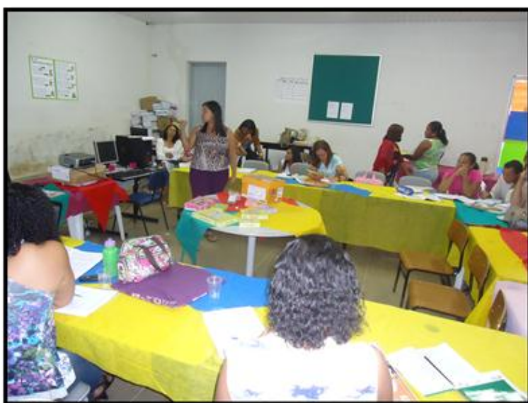
Figura 19: planejamento pedagógico

“Nós podemos muito, Nós podemos mais, Vamos lá pra ver o que será”. (Sementes do amanhã de Gonzaga Jr).