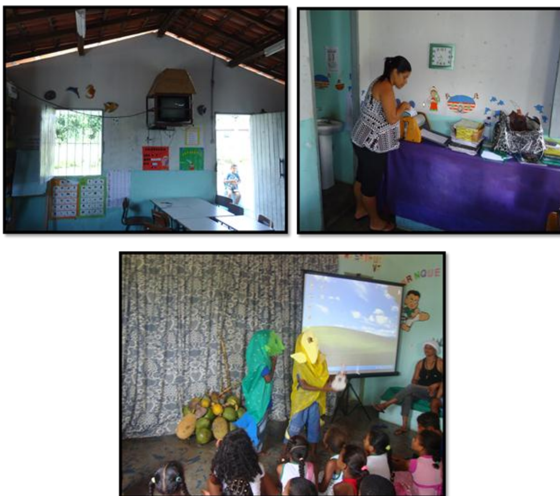
Figura 9: Os recursos tecnológicos da escola

que cada coisa ocupa no cotidiano da escola. Em se tratando dos recursos tecnológicos que a escola dispõe, há um mimeógrafo para reproduzir as atividades escritas, uma televisão de 20 polegadas, um projetor utilizado apenas nos momentos comemorativos, um notebook sem acesso a internet e uma impressora que é utilizada esporadicamente por conta da demora da equipe administrativa da escola em recarregar o toner do aparelho.