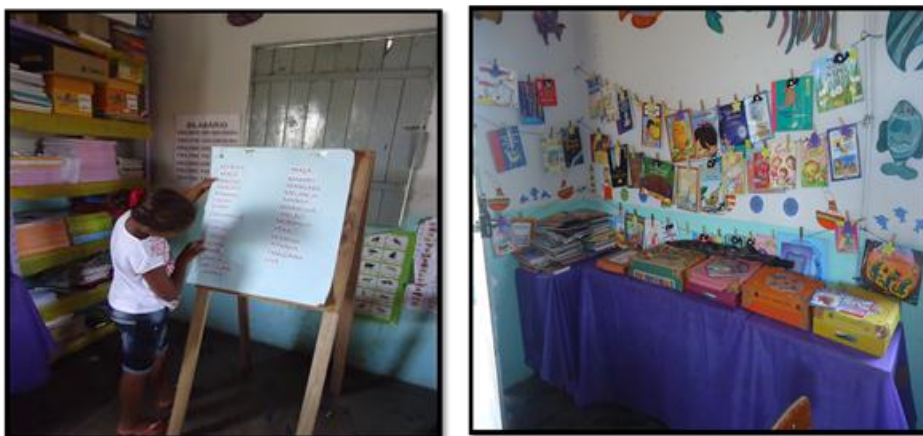
Figura: 18- Cantinhos de aprendizagens

Mais de 30 anos passaram-se em relação à alfabetização entrelaçada ao tema gerador e círculo de cultura, tendo em vista a tão defendida conscientização, para alfabetização idealizada por Freire, e, as práticas escolares continuam presas a conjugação das famílias fonética, a identificação de hipótese de nível de escrita para o treinamento de formação de palavras, para dominar as regras do sistema de escrita sem dominar a aprendizagem consciente. Quer dizer, a sala multisseriada da escola Chico Mendes traz a organização “dos cantinhos de aprendizagem”, a dinâmica da sala de aula, demonstra que esses cantinhos são utilizados como ferramentas ou fontes de pesquisa para negociação do saber, para construção de outros artefatos culturais, os quais são como se fosse o espaço tecnológico, inventado para ser utilizado pelos alunos.