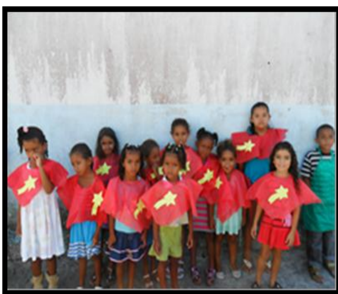
Figura 39 Coral- Crianças cantando as músicas da cultura local

“Se você não concordar Não posso me desculpar Não canto pra enganar Vou pegar minha viola Vou deixar você de lado Vou cantar noutro lugar.” (Música disparada de Jair Rodrigues)