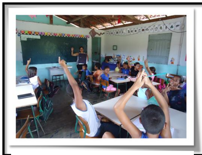
Figura 28: Organização do trabalho na sala

Em seguida, na sala, realizariam o reconto coletivo do que ouviram, prosseguindo, transformariam o texto numa paródia, realizando o lançamento da música na área da escola com a participação da comunidade. Para a professora, o objetivo da atividade era produzir textos rimados, de uma maneira dinâmica, como pesquisadora participante, as etapas da atividade praticada, oportunizaram as seguintes reflexões: