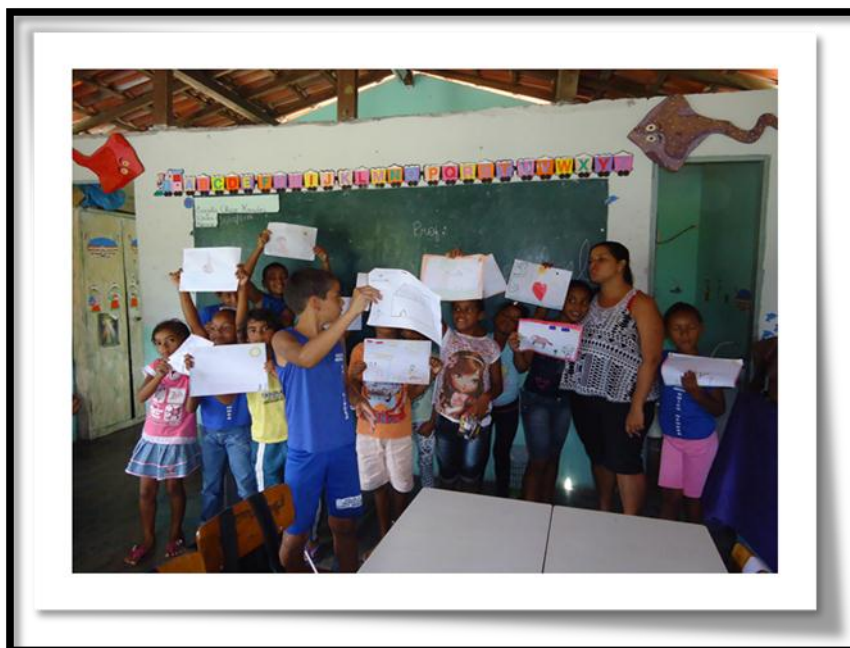
Figura 30: Produções na sala de aula