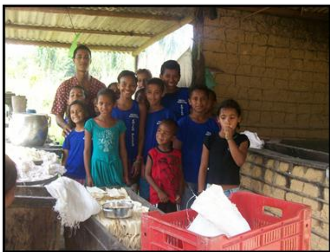
Figura 17: Pesquisa na casa de farinha

“Porque tudo é educação, é matéria de todo o tempo, Ensinem a quem pensa que sabe de tudo.” ( Anjos da guarda de Lecy Brandão)