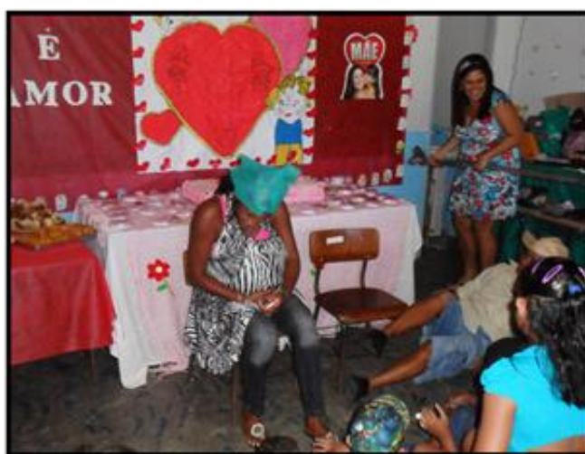
Figura 24: Prática educativa com a participação da comunidade

Haja vista que no campo, a prática educativa precisa ter um movimento dentro e fora da escola, ademais, os atos educativos deste lugar devem resultar de trocas de experiências entre as pessoas, da pesquisa de campo, do conhecimento do repertório cultural e de mundo, os quais essas pessoas têm conhecimento, para assim construir o aprendizado mútuo. Dessa forma, na pedagogia viva todos são protagonistas, o conteúdo está vivo nas contações de casos, nas festas que fazem nos ditos populares, nas músicas que cantam, nos cálculos que constroem. Como resultado tudo pode ser aproveitado e transformado em conteúdo real apropriando-se da realidade para construir a leitura de mundo, a leitura da realidade social e da palavra que produz.