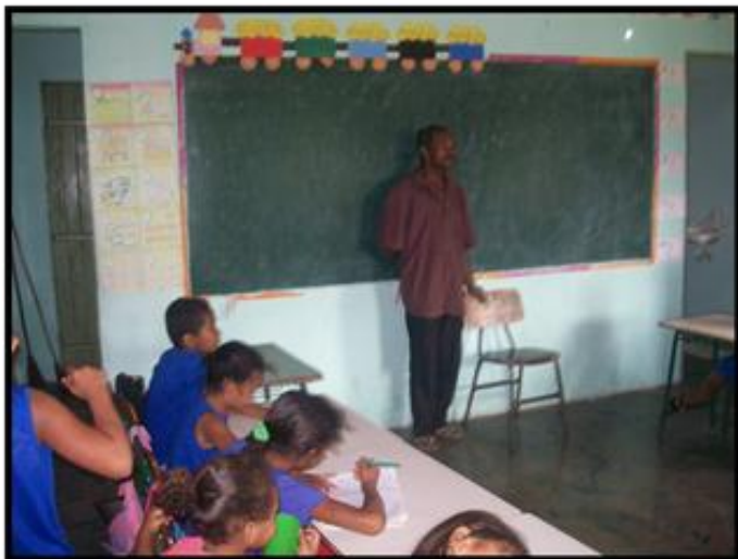
Figura 37- Palestra ministrada por morador sobre Provérbio popular

“Cada um de nós compõe a sua história, e cada ser em si carrega o dom de ser capaz, e ser feliz”.