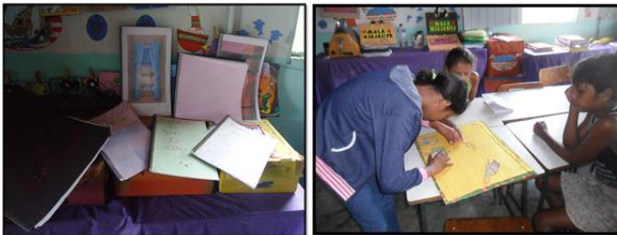
Figura 13: Livros produzidos pelos alunos

De maneira idêntica, a prática parece valorizar o conhecimento individual desse povo. Entretanto, essa práxis de sala de aula ainda não toma posse da realidade, de forma a tocar todos os sujeitos no processo de ação-reflexão-ação. Sousa (2004 p.65) instiga que: