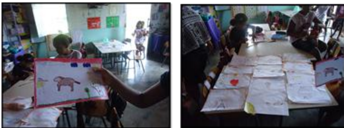
Figura 36: Resultado da atividade

À medida que se apresentava as imagens perceber uma prática pedagógica colaborativa, todos, independente do nível de conhecimento, tiveram sua participação, desvendando o dito popular escondido na imagem, recitando outro ditado em que aparecesse a palavra solicitada pela professora, criando uma encenação para que os demais colegas identificassem o provérbio. A atividade respeitou os saberes de todos, os diferentes ritmos, trabalhou com as diversas formas de se expressar, com habilidades multissensoriais, além do trabalho de consciência fonológica iniciado no pequeno grupo. Para esta situação Vygotsky destaca que: