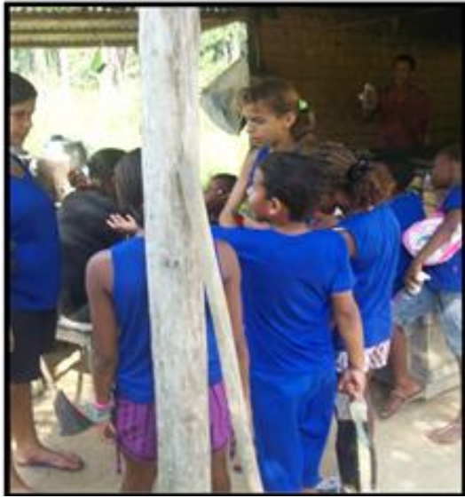
Figura 34- Atividade itinerante por meio de pesquisa de campo

“Tem gente enganando a gente, Veja nossa vida como está, Mas eu sei que um dia A gente aprende.” (Mais uma vez de Flávio Venturini)