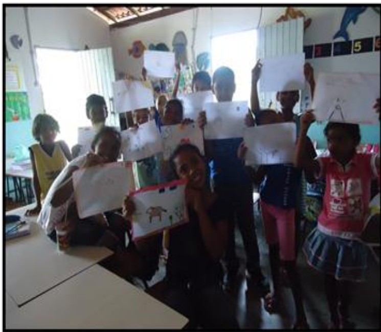
Figura 14: Construção de nova pesquisa de campo

“Sim, eu sei Quem espera também alcança Mas espera também cansa” Ninguém dá o que não tem (Letra de João Augusto)