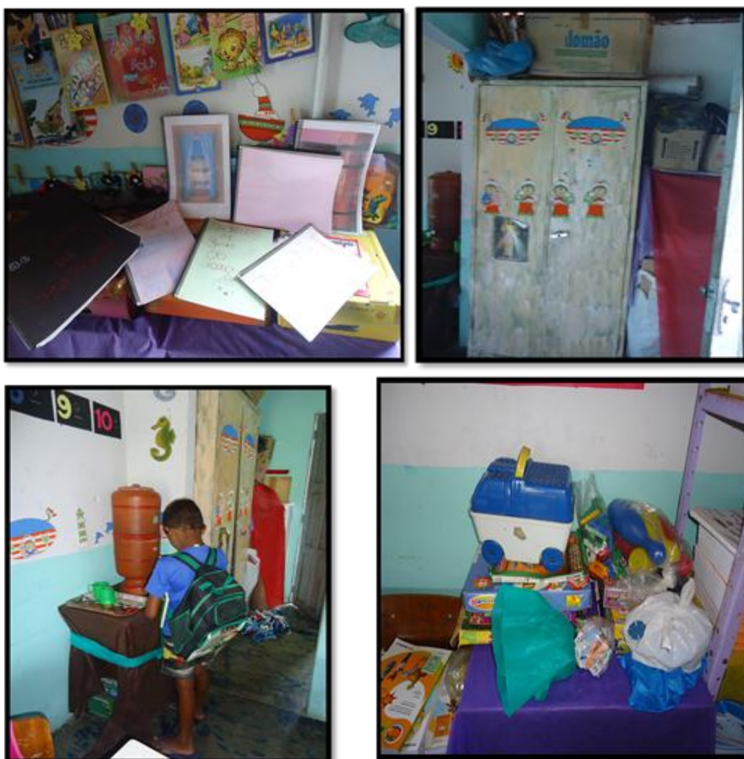
Figura 8: Organização do espaço escolar

Em contrapartida, se tratando ainda do espaço físico, o mobiliário é antigo e mesmo com o cuidado que as crianças têm com o material, o desgaste do tempo acaba apresentando a ferrugem no armário, há uma estante improvisada para organização dos livros de fábulas e das produções dos alunos. Além disso, a cozinha é pequena, mas, muito bem cuidada, a água é proveniente de poço cartesiano, um pequeno filtro de barro, o qual ajuda na purificação da água. Pode-se salientar que há um espaço lúdico com produtos industrializados e materiais confeccionados pelos alunos e pela professora.