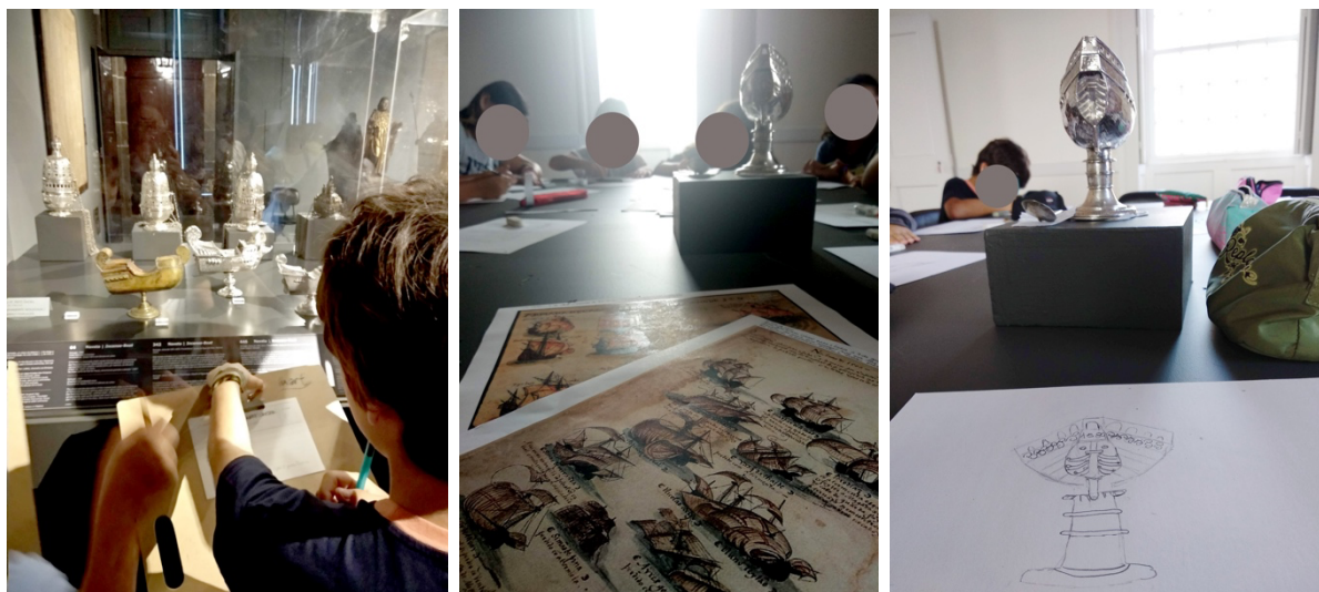
Figura 2- Oficina todos a Bordo! No MASF.

Numa das escolas a atividade acima descrita foi adaptada à efeméride do Natal, transformando e para além do desenho de observação os estudantes recriaram a peça para esta temática e decoraram a mesma com outros elementos presentes nas obras do museu como por exemplo pormenores de anjos. Esta é a verificação de que uma atividade planeada de forma genérica depois pode se adaptar aos grupos, podemos ver abaixo algumas das imagens.