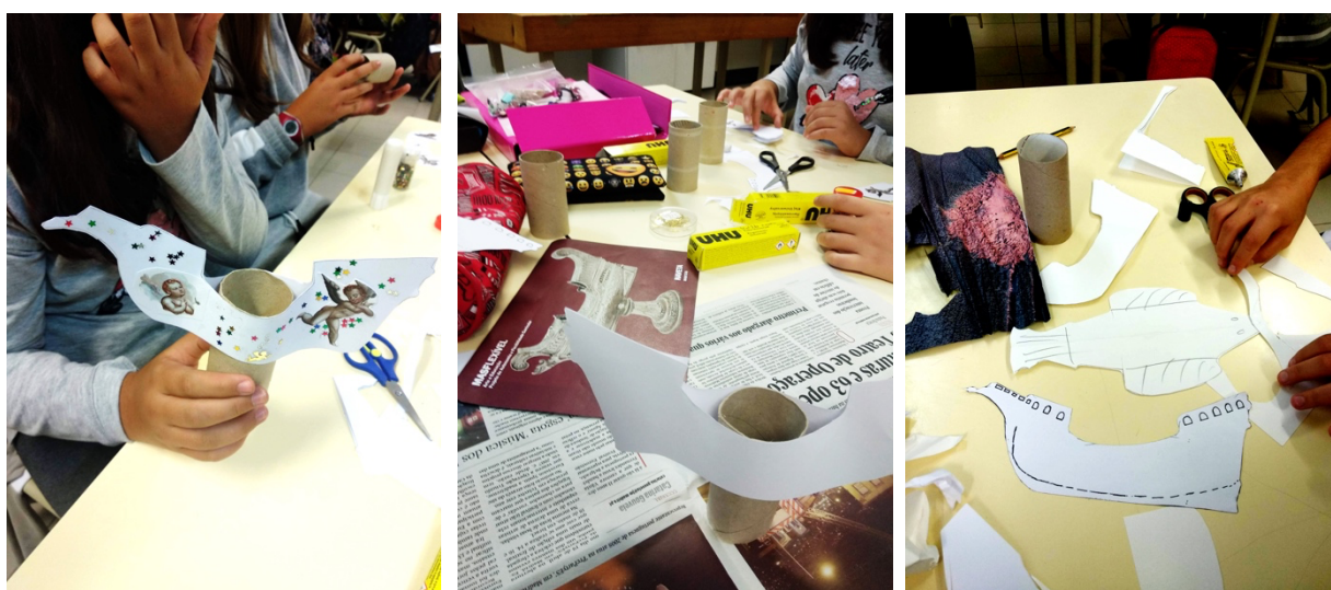
Figura 3- Oficina todos a Bordo! Na escola.