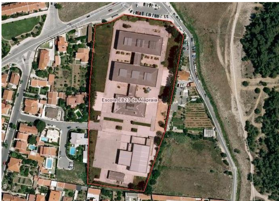
Figura 2.3 Representação cartográfica da escola de Alapraia

A escola de Alapraia dispõe de seis campos para a prática do Badminton (quatro no polidesportivo e dois no ginásio). A representação cartográfica da Escola de Alapraia e os respetivos espaços desportivos são apresentados na Figura 2.3.