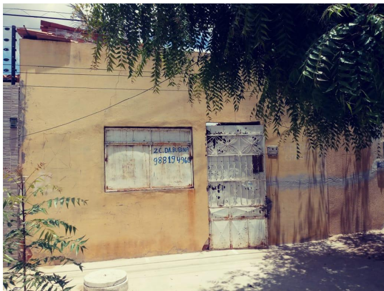
Figura 01 – Frente da casa onde ocorriam as aulas no início da observação participante

A casa está localizada na Rua Curitiba, nº 190, Bairro José e Maria, Petrolina – PE.