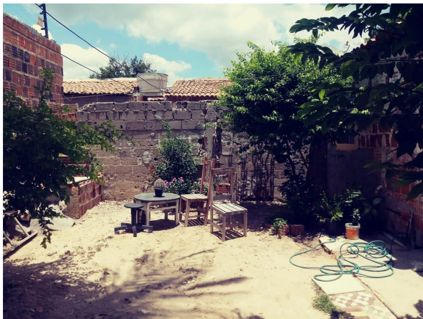
Figura 03 – O quintal onde ocorriam as aulas no primeiro ambiente de aprendizagem observado

Nessa imagem, pode-se vislumbrar o quintal no qual ocorriam as aulas. O pesquisador resolveu tirar as fotos durante o dia, pois assim permite-se maior visibilidade. As cadeiras em que sentavam os aprendizes e o Rabino ficavam dispostas geralmente em círculo.