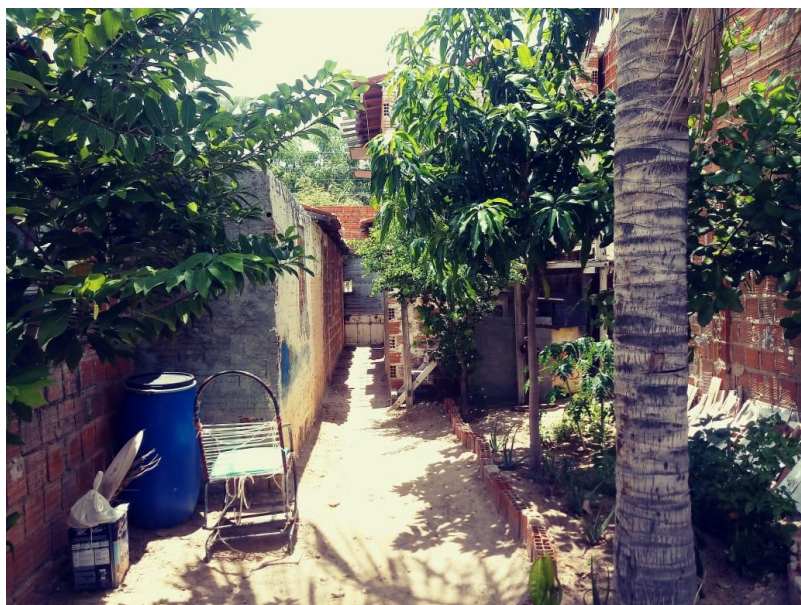
Figura 02 – Entrada para o Quintal

Nessa figura pode-se observar um corredor de permite a entrada até o quintal.